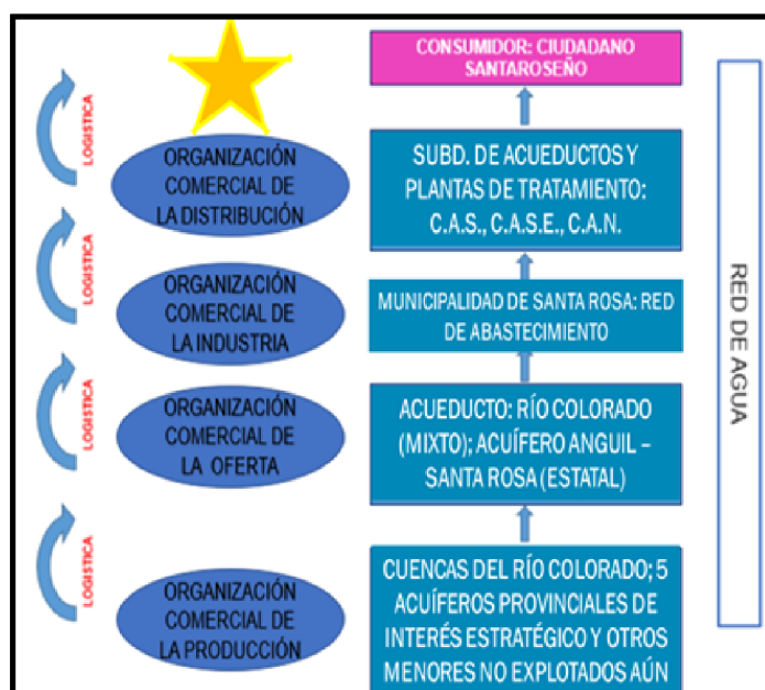
Figura 1: Matriz de PONS aplicada a DAGSA.