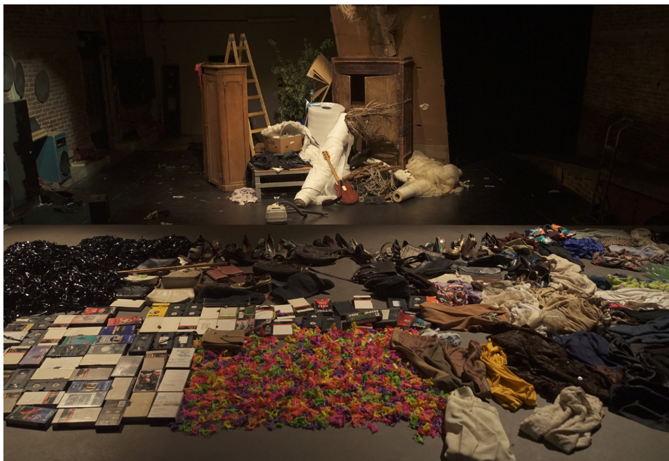
▲ Figura 1. Colección de objetos desplegada en el galpón de La Grieta