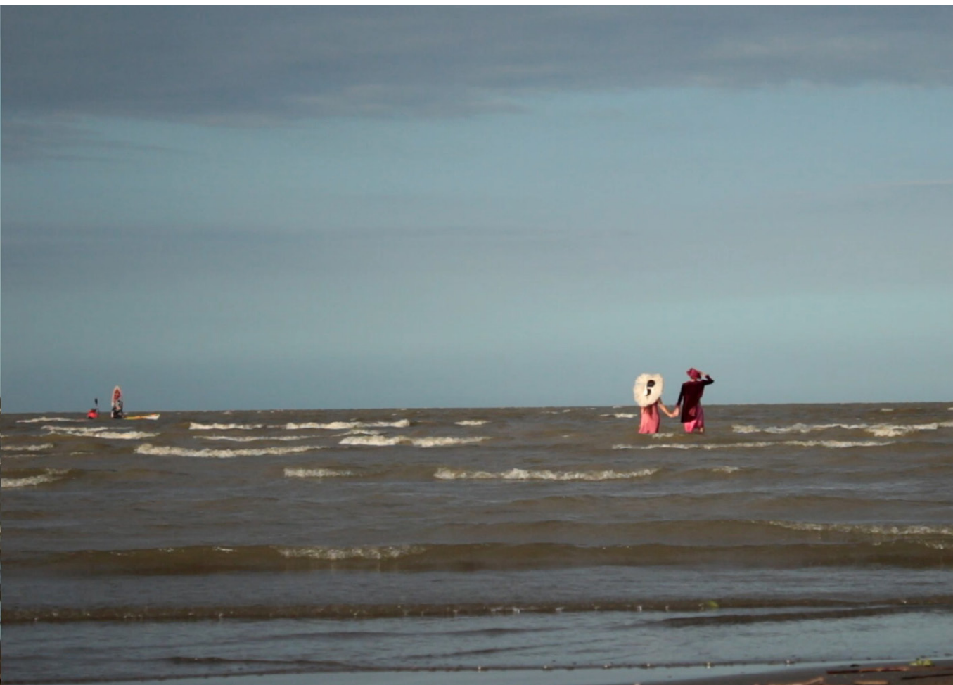
▲ Figura 7. Acción en el río en TODO Performance

Nota. Fuente. Colección personal Laura Valencia.