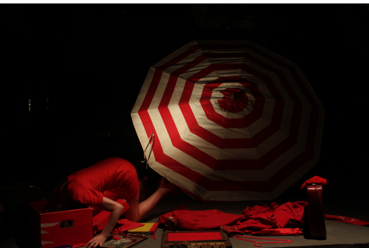
▲ Figura 4. Uso de la sombrilla en TODO , la imposibilidad de vaciar