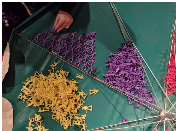
▲ Figura 5. Uso de la sombrilla en TODO Performance

Nota. Fuente. Colección personal Laura Valencia.