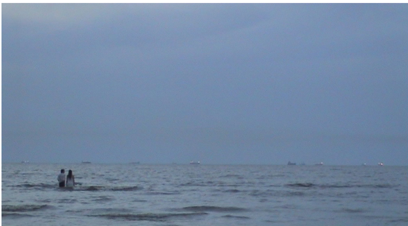
▲ Figura 8. Fotografía de ensayo en Punta Lara de la obra Le agregué un sueño (Una promesa) (2010)

Entonces, si consideramos la idea de que estos materiales (los objetos-restos) se revelan como materia de supervivencias, como potenciales activadores de memoria, considero que pensar en un posible archivo escénico es pensar en un archivo construido a partir de supervivencias en constante actualización. Su particularidad es que estas no cuentan con un