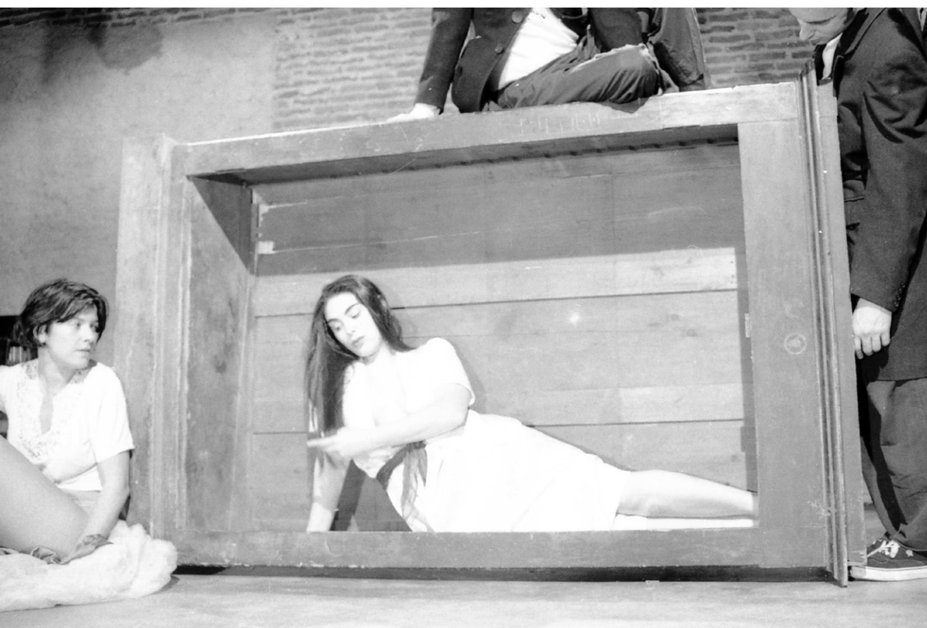
▲ Figura 6. Ropero en uso en la obra Eterna (1998)

Si retomamos la idea de la historia como montaje, se puede asociar la aparición de los restos en escena a aquella “imagen dialéctica” como sustituta de la noción lineal de la historia de la que habla Didi-Huberman (2011) a partir de Benjamin, es decir, como una imagen que se presenta en el curso histórico, no como un acontecimiento fijo que se mantiene insensible a su devenir, sino que produce una temporalidad de doble faz y, con ello, una historicidad