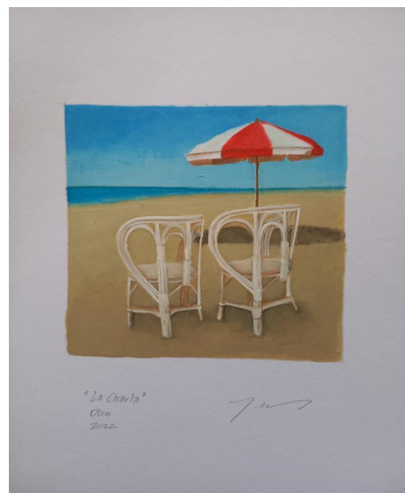
Imagen 2 - La charla

La obra de Yuliana Scardapane 4 , regalada a uno de los autores de este artículo en el que dos típicas sillas marplatenses miran la inmensidad del mar, dan cuenta de la charla, el encuentro esperado, la intimidad deseada y la condición sensible de esa vida narrada.