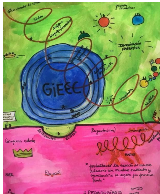
Imagen 1 - Una narrativa para el GIEEC

tienen la característica de no pensar al campo educativo cerrado, sino en la cultura abierto, dinámico y flexible. Ahí reside uno de los aportes fundamentales: no compartimentar el campo y no perder de vista su integralidad. Hay, en ese punto, aportes personales, estéticos y políticos desde la perspectiva en la que miramos nuestros objetos. La categoría de “expansión biográfica” (PORTA, 2021) da cuenta de esta posición que anuda cuestiones metodológicas y temáticas en torno a la investigación narrativa, biográfica y autobiográfica en educación.