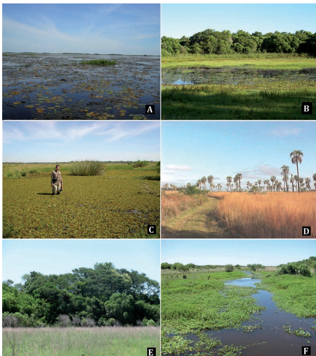
Fig. 1. Ambientes característicos del Parque Nacional Mburucuyá. A: Esteros de Santa Lucía. B: Vegetación asociada a lagunas transitorias. C: Población de Salvinia auriculata en zonas inundables. D: Palmar de Butia yatay y sabanas de Andropogon lateralis . E: Fisonomía externa de los Bosques higrófilos. F: Arroyo Portillo, con vegetación palustre asociada.

Descripción e iconografía: Capurro, 1974: 375-377, Fig. 2.