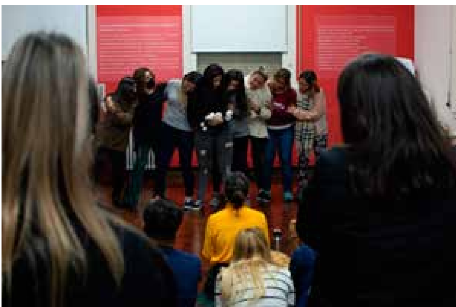
Imagen 4 y 5. Realización de la performance-taller en el Normal 3.