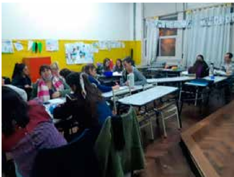
Imagen 2 y 3. Integrantes del Conversatorio y del trabajo en el aula en pequeños grupos.