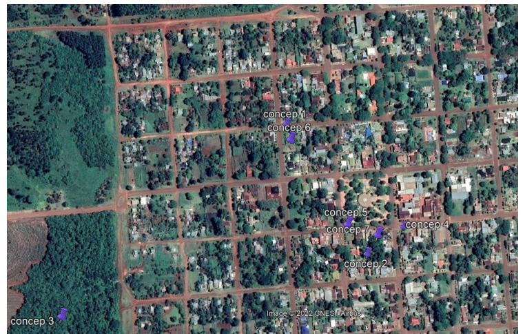
Figura 3. Áreas excavadas del casco histórico del pueblo.

Se realizaron sondeos exploratorios en los lugares seleccionados a partir de la superposición de planos, buscando una primera