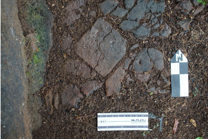
Figura 7. Sector C con baldosas en superficie.

observar en la superficie (Figura 7). Se excavó hasta unos 50 cm de profundidad de forma pareja en toda el área. Al igual que en los sectores anteriores, como medida de conservación se tapó todo con la tierra removida, quedando el lugar limpio y con la menor alteración posible.