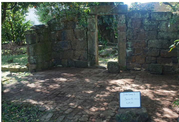
Figura 5. Estructura y ubicación del sector A.

Se excavaron hasta 50 cm, y se subdividió el área en un sondeo de 50 x 50 cm para excavar unos 10 cm más y poder observar la tierra negra, o el nivel donde ya no salía material.