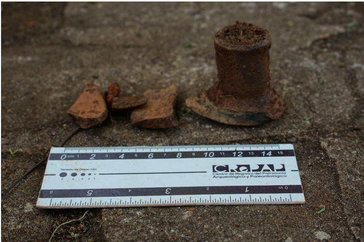
Figura 9. Segundo candelero recuperado junto a fragmentos del mismo.

El primer candelero tiene un espesor máximo en su base de de 7,5 cm, mínimo de 3,3 cm, altura de 9,4 cm y ancho de 7,7 cm. Realizados en material cerámico, presenta una base circular y en su centro un soporte de forma cilíndrica en donde se llevaba la vela. Tiene una coloración oscura.