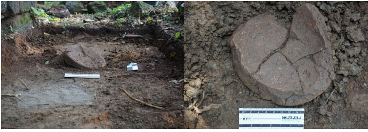
Figura 10. Base de vasija recuperada en Concepción 7, sector C.