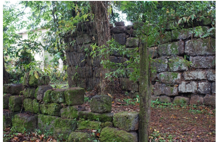
Figura 6. Ubicación del sector B.

El sector B se definió a unos 6 metros al Sur del sector A, en un área cubierta de vegetación limitado en su lado norte por el muro de la estructura principal, y en sus lados Oeste y Sur por muros de unos 84 cm promedio de altura realizados en rocas itacurú (Figura 6).