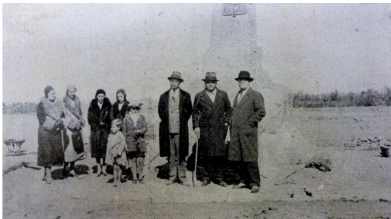
Figura 3. Turistas en el Campo Histórico El Plumerillo

patriotas que con él colaboraron” (Dirección de Turismo de Mendoza, 1941a). Otra guía turística local que hace referencia a los sitios sanmartinianos es la “Guía de Mendoza” de Francisco Giménez Puga 17 (Giménez Puga, 1940).