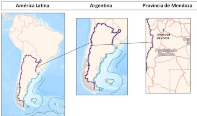
Figura 1. Localización geográfica de la Provincia de Mendoza y su ciudad cabecera, Argentina

turístico de gran importancia a nivel nacional e internacional. El espacio urbano mendocino tuvo un rol primordial durante la campaña libertadora liderada por el General José de San Martín en 1817, razón por la cual atesora numerosos sitios vinculados a la gesta y a la vida cotidiana del prócer.