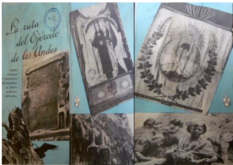
Figura 4. La ruta del Ejército de Los Andes