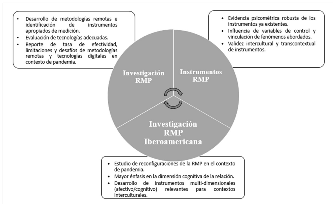
Figura 3. Matriz de recomendaciones RMP.

Con respecto al primer punto, la pandemia presenta el desafío de avanzar en el abordaje de la reconfiguración de la RMP a través de metodologías remotas (ej. uso de instrumentos como escalas y cuestionarios). En este contexto, además de mejorar la calidad de los instrumentos disponibles (como se reflexiona debajo), desde un punto de vista práctico, será también necesario evaluar cuáles son las tecnologías más adecuadas (ej. plataformas de cuestionarios online) para este campo de investigación en comunicación considerando que el relevamiento de información en esta área del conocimiento se ha realizado más comúnmente de forma presencial, mediante la grabación de datos naturales. Se deberá reflexionar sobre