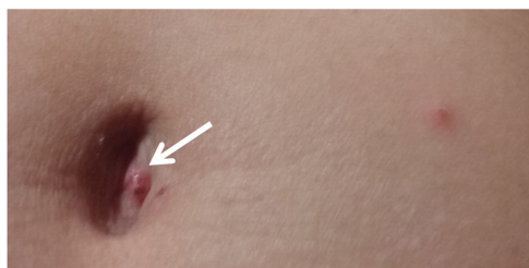
Figura 2 Área umbilical desde donde se retiró una costra (flecha).

nordeste de Misiones y protege uno de los biomas más amenazados ( hotspots ) a escala mundial: la Selva Paranaense de Misiones, un relicto de bosque húmedo tropical que se extiende desde Serra do Mar en Brasil hasta el este de Paraguay y el noreste de Misiones, Argentina (25° 50' 34" S, 54° 06' 08" O) (fig. 1). La Selva Paranaense alberga un conjunto intacto de vertebrados, incluyendo aves, muchos carnívoros medianos y grandes (p. ej., yaguaré, puma y ocelote), grandes herbívoros (p. ej., tapir, venado y pecarí) y una vegetación exclusiva de esta área. Presenta un clima subtropical, con una temperatura media anual de 16-22 °C y una variación anual relativamente alta. Las precipitaciones oscilan entre los 1.000 y 2.200 mm por año 4,12 .