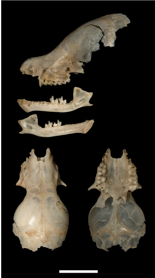
Foto 1. Cráneo y mandíbula del murcielaguito oscuro ( Myotis nigricans ), Chiroptera-Vespertilionidae, recuperado a partir de una egagrópila de Athene cunicularia de Posadas, Misiones. Arriba, cráneo y hemimandíbula en vista lateral, abajo (izquierda), cráneo en vista dorsal, abajo (derecha) cráneo en vista ventral. Escala = 5 mm.

oscura o negruzca, que habita ambientes antrópicos, puentes, alcantarillas, techos de viviendas y bajo la corteza de los árboles. Aunque su distribución podría ser más amplia, se han encontrado registros en las provincias de Catamarca, Chaco, Corrientes, Formosa, Jujuy, Salta, Santiago del Estero, Tucumán, Santa Fe y Misiones. En Misiones los registros son escasos y se conocen solamente para los departamentos Iguazú, Caingúas, Candelaria, San Ignacio y Oberá (Mapa 1) (Barquez et al. , 2020).