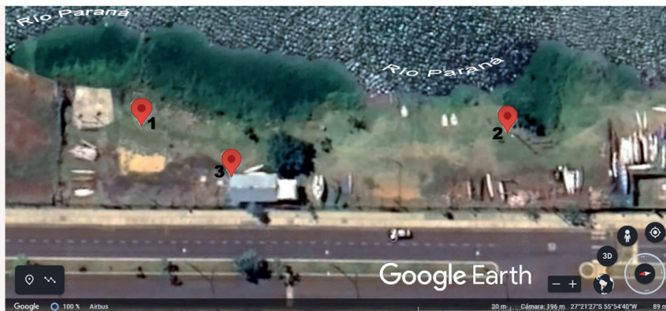
Mapa 2. Recolección de egagrópilas de lechucita vizcachera ( Athene cucularia ), Club Náutico "Vairuzú", 13 de agosto de 2022, Posadas, Misiones, Argentina. 1) Madriguera activa; 2) Poste de alumbrado; 3) Alero guardería de kayacs.