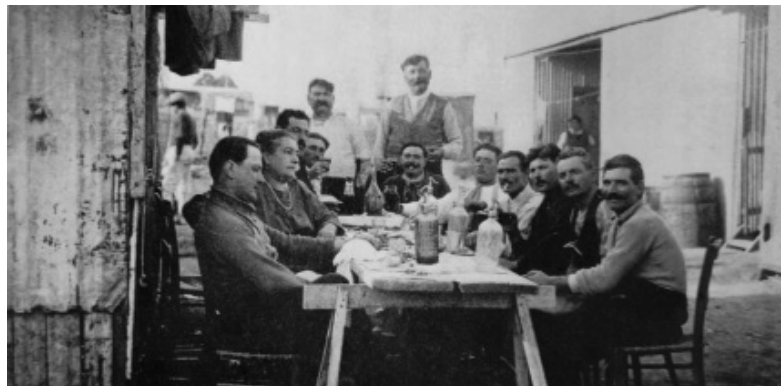
Figura 7: Repartición del pago a la vuelta de la pesca. Obsérvese el ambiente dominado por las construcciones de madera y chapa y, al fondo, los barriles de salado de anchoítas.