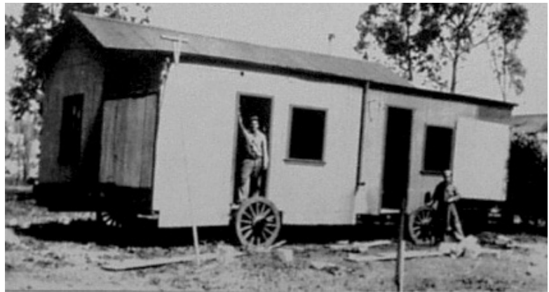
Figura 6: Traslado de casilla por Germán Gigena en 1939.