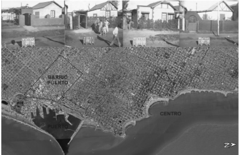
Figura 1: Área actual de Mar del Plata. Se marca el centro de la ciudad, el puerto y su barrio aledaño. En la parte superior, imágenes del paisaje del barrio portuario dominado por casillas entre 1939 y 1941.

Anales del IAA #53 (1) - enero / junio de 2023 - (1-15) - ISSN 2362-2024