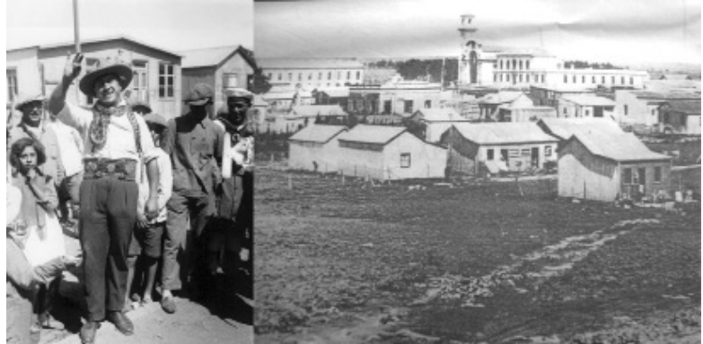
Figura 5: Vendedor de brillantes con una vibora en el cuello. Obsérvese al fondo el perfil de las casillas de chapa y madera y, en la foto siguiente, el paisaje del barrio portuario dominado por esta tipología residencial en el entorno de la Iglesia y la Usina.