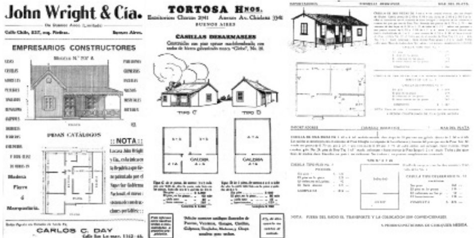
Figura 2: Modelos de catálogos de casillas prefabricadas de distintas empresas. De izquierda a derecha: John Wright & Cia., Tortosa Hnos. de Buenos Aires y Tiribelli Hnos. de Mar del Plata. Fuentes: Caras y Caretas, febrero de 1909 y septiembre de 1926 y Cova, 1981, p. 15, respectivamente.

Anales del IAA #53 (1) - enero / junio de 2023 - (1-15) - ISSN 2362-2024