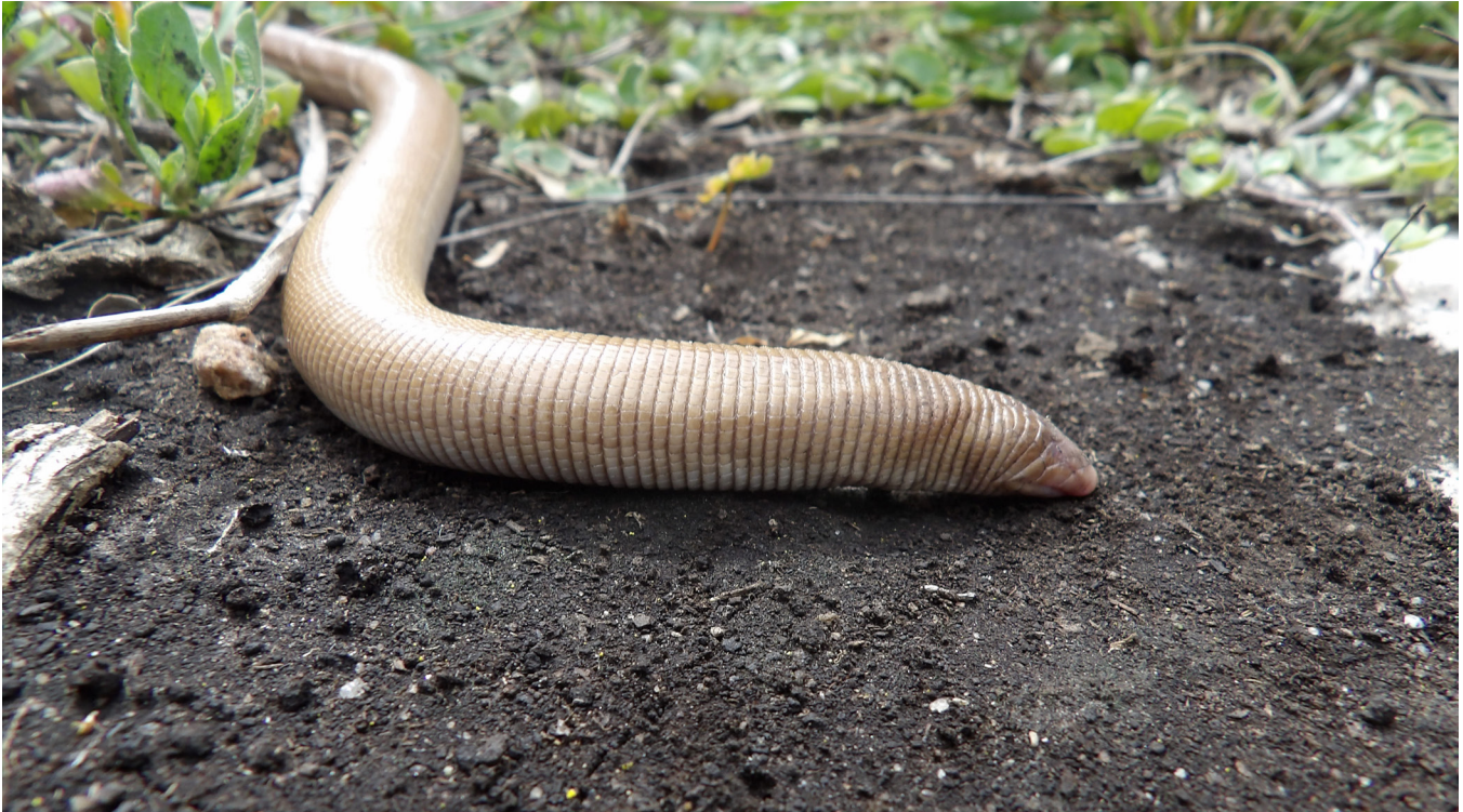
Figure 2. Amphisbaena angustifrons (MLP R. 6838) found in Reserva Paititi, Sierra de los Padres Department, Buenos Aires.