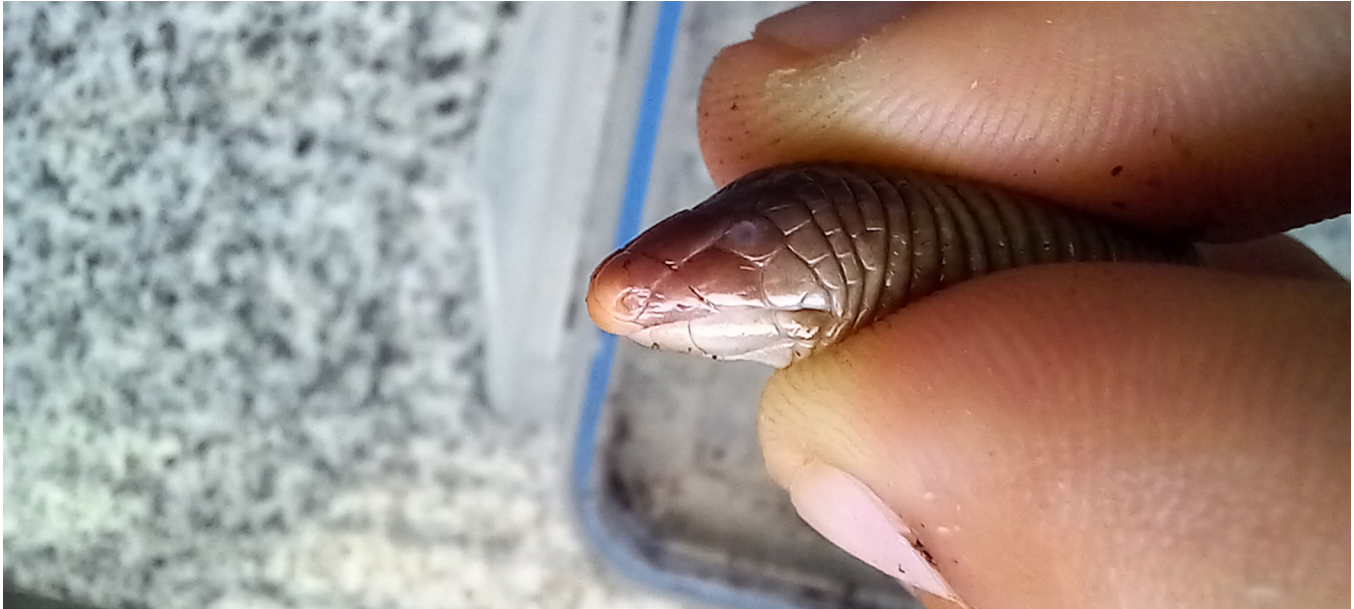
Figure 3. Amphisbaena angustifrons (MLP R. 6849) found in Boca de la Sierra, Azul Department, Buenos Aires. In this view, the 4 supralabial scales characteristic of the species can be seen.