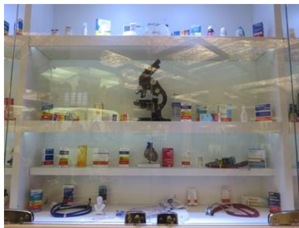
Imagen 8 - Vitrinas con exvotos, Sala das Promessas de Aparecida.