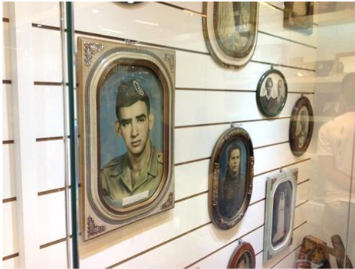
Imagen 7 - Exvotos con fotografías pintadas expuestos en vitrinas dentro de la Sala das Promessas del Santuario de Aparecida.