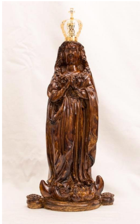
Imagen 2 - Imagen de Nuestra Señora de Aparecida con corona.