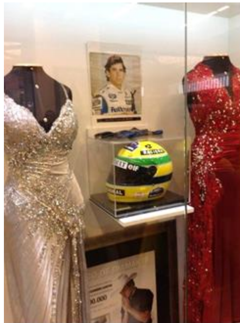
Imagen 14 - Vitrina de exvotos, Sala das Promessas de Aparecida. Casco de Ayrton Senna.