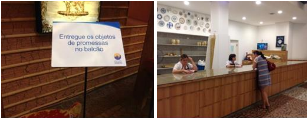
Imágenes 11 y 12 - Recepción de exvotos en el Santuario de Aparecida.

Fuente: Colección personal de la autora. 2015.