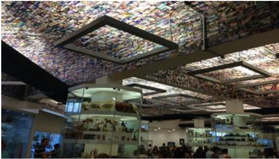
Imagen 17 - Vista de la Sala das Promessas del Santuario de Aparecida.