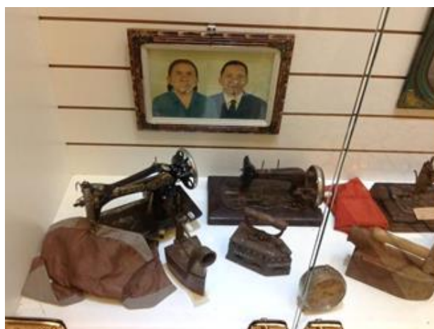
Imagen 6. Vitrinas con exvotos, Sala das Promessas de Aparecida.