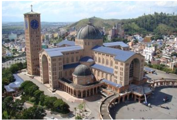
Imagen 1 - Vista general del Santuario de Aparecida.