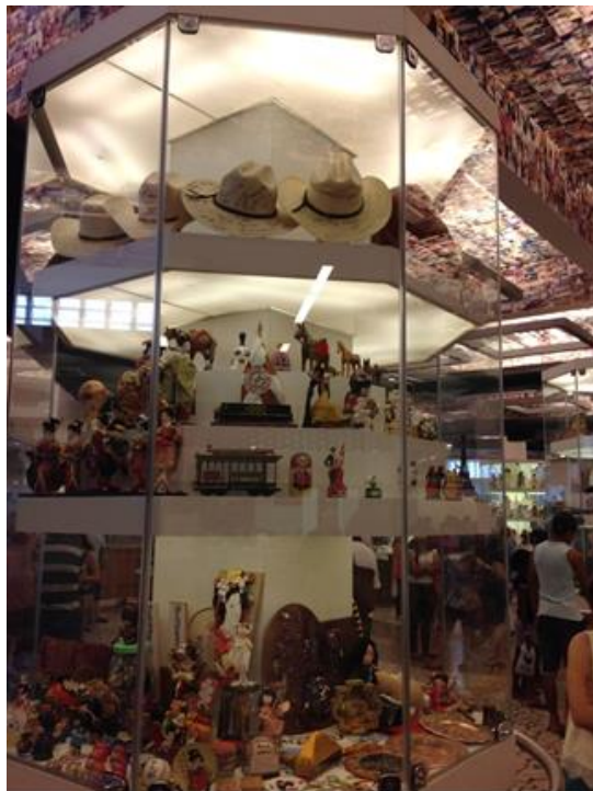
Imagen 10 – Vitrinas con exvotos, Sala das Promessas de Aparecida.