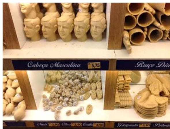
Imagen 5 - Exvotos de cera en venta en el Santuario de Aparecida.