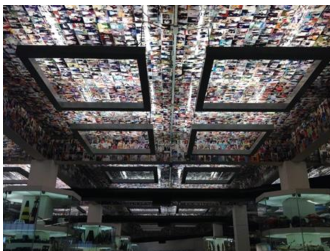
Imagen 16 - Vista del techo recubierto de exvotos fotográficos en la Sala das Promessas del Santuario de Aparecida.

Fuente: Colección personal de le autore, 2015.