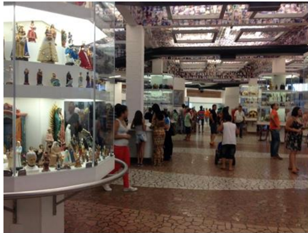
Imagen 15 –Vista de la Sala das Promessas del Santuario de Aparecida.