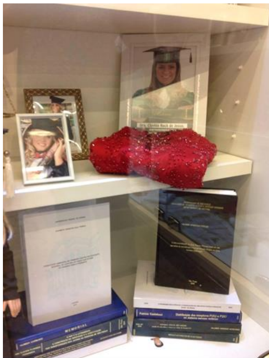
Imagen 9 - Vitrinas con exvotos (tesis doctorales). Sala das Promessas de Aparecida.