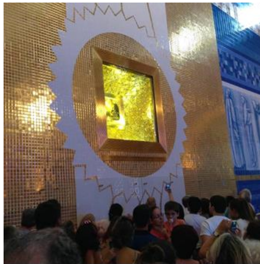
Imagen 4 - Virgen Aparecida, en su nicho, donde está expuesta.