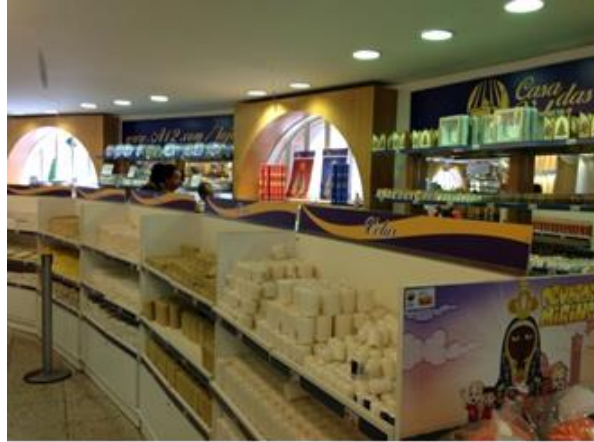
Imagen 13- Tienda de venta de exvotos. Santuario de Aparecida.