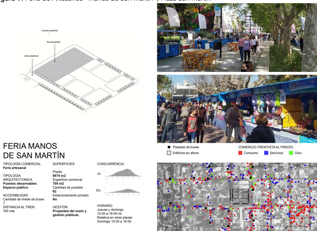
Figura 9. Feria de Artesanos “Manos de San Martín”, Plaza San Martín