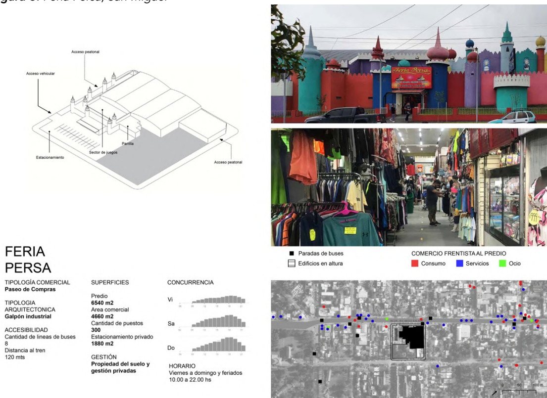
Figura 6. Feria Persa, San Miguel

El análisis de dos casos representativos de paseos de compras, la Feria Persa y el Paseo José León Suarez, permitió caracterizar esta tipología más pormenorizadamente (Figura 6 y Figura 7). La primera funciona desde 1997, en una ex discoteca de los años '70, y el segundo en una nave construida en 2008 en terrenos ferroviarios. Cada uno ocupa alrededor de 4.500 m 2 de superficie comercial, aglutinando más de 300 puestos de venta, organizados en hileras separadas por pasillos.