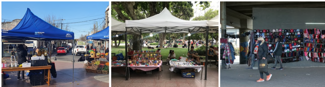
Figura 5. Mercado Popular Itinerante, feria artesanal plaza San Miguel, venta ambulante estación José León Suarez