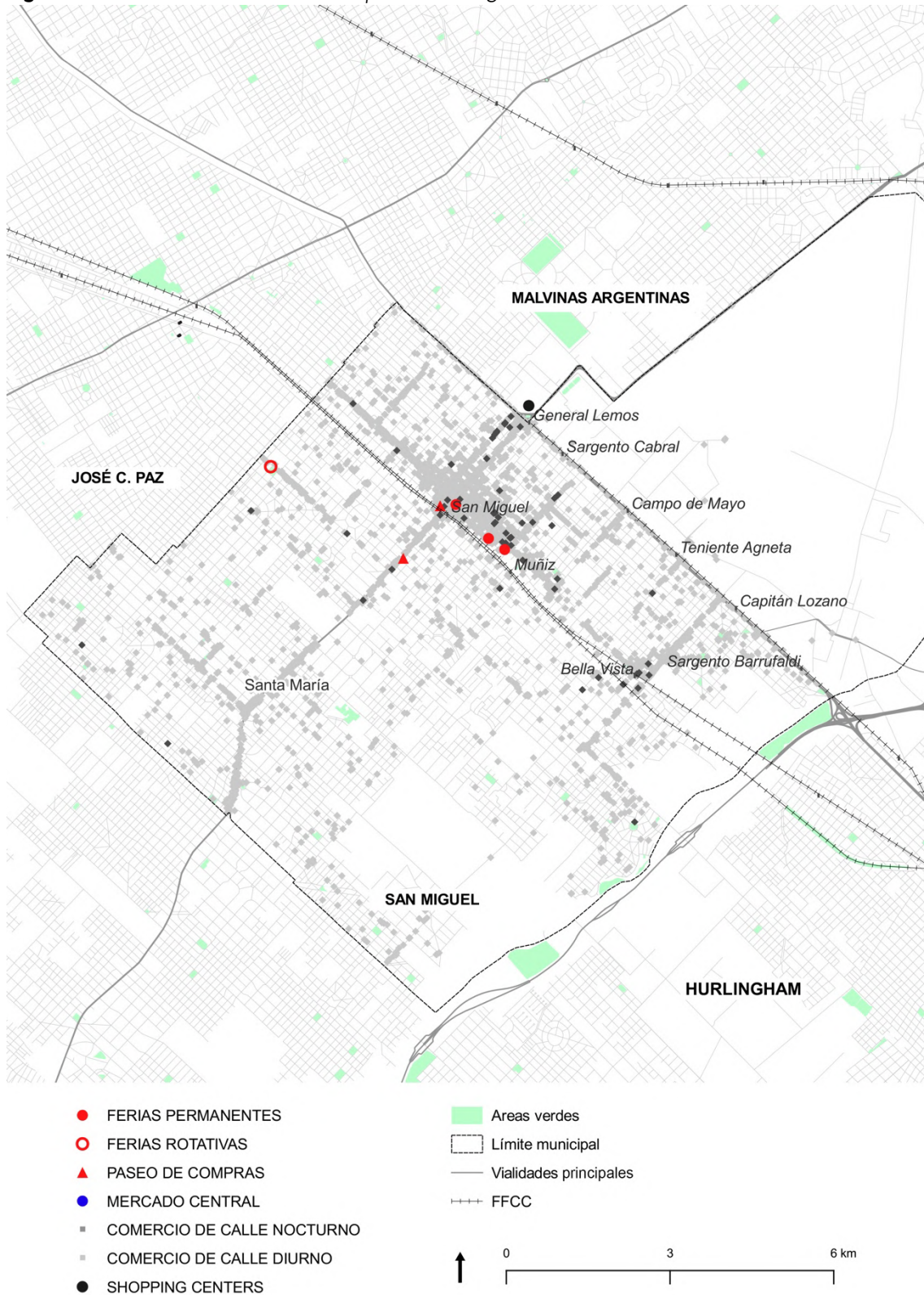
Figura 2. Estructura comercial del municipio de San Miguel