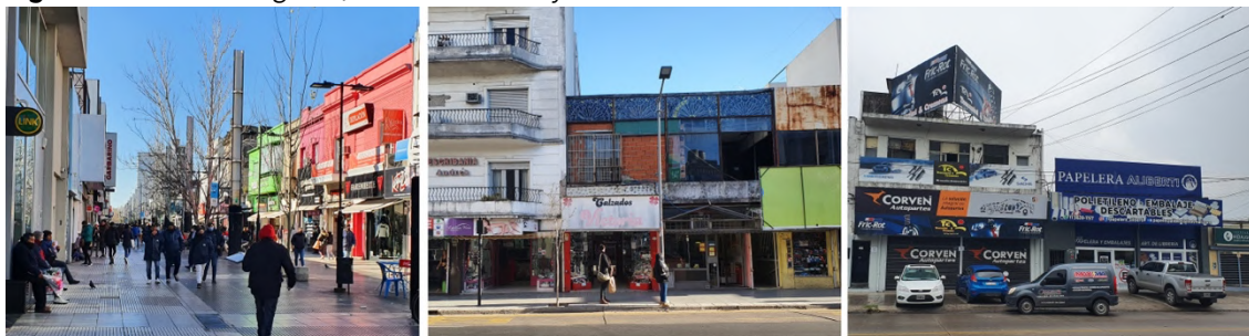
Figura 4. Peatonal Belgrano, calle San Martín y ruta 23-Av. Balbín

de San Miguel. Esta última constituye la localidad más poblada del partido, 16 y su centralidad está creciendo rápidamente, desde la ruta 23 a lo largo de la calle Maestro Ferreyra, con una oferta nucleada de comercio barrial (ferreterías, panaderías, verdulerías, repuestos, despensas, etc.).