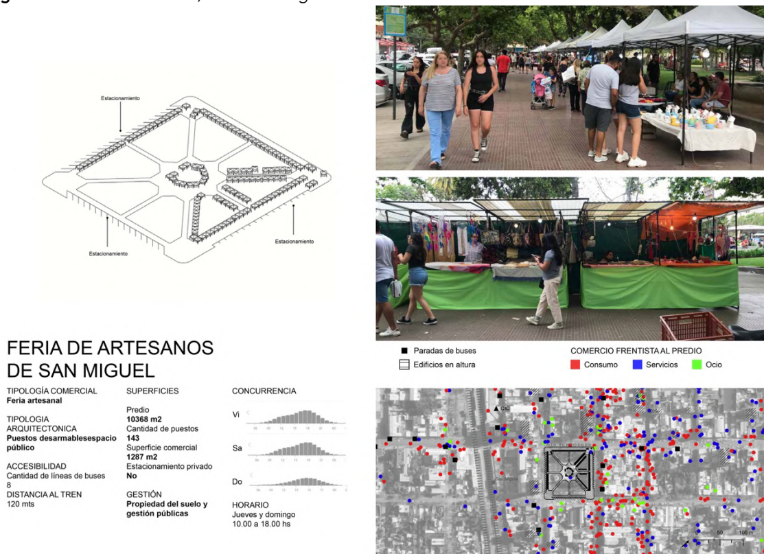
Figura 8. Feria de Artesanos, Plaza San Miguel