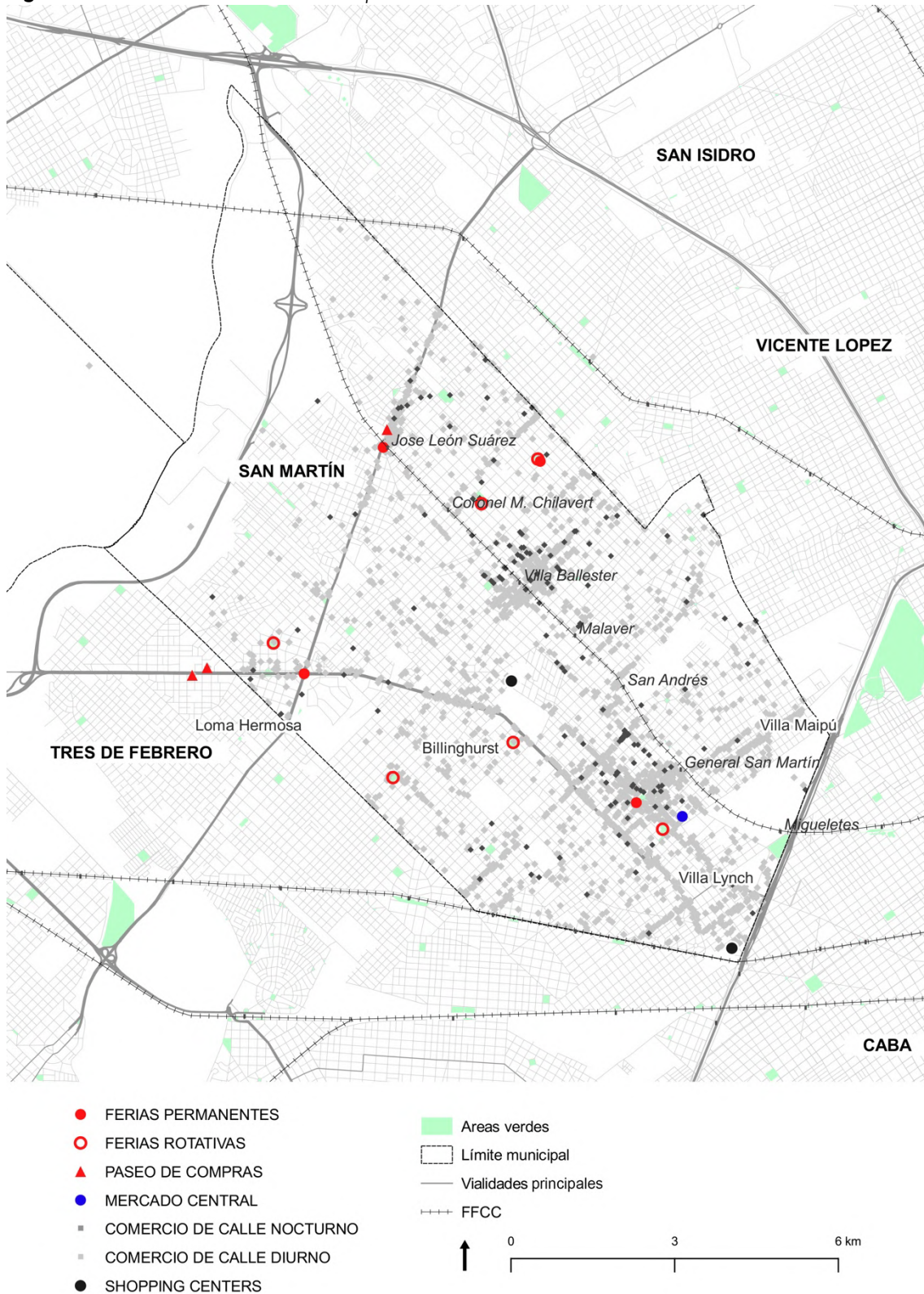
Figura 3. Estructura comercial del municipio de San Martín