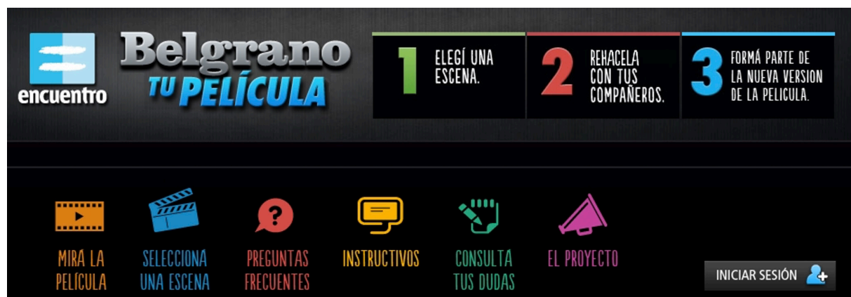
Figura 1 Captura de pantalla micrositio interactivo Belgrano, tu película

que tuvieron lugar durante esos primeros 30 años. El proyecto se complementa con material de descarga para el trabajo áulico y una versión offline. Finalmente, cada usuario podía subir su propio testimonio narrando un hecho relevante que hubiera ocurrido en alguno de aquellos primeros 30 años de Democracia, como una forma de apelar a la construcción colectiva de memoria.