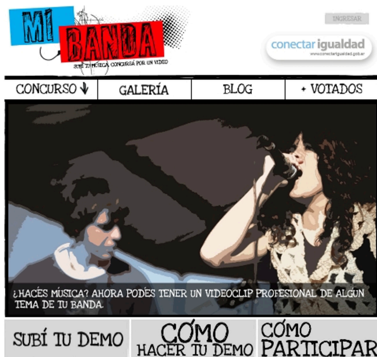
Figura 2 Captura de pantalla micrositio interactivo Mi Banda