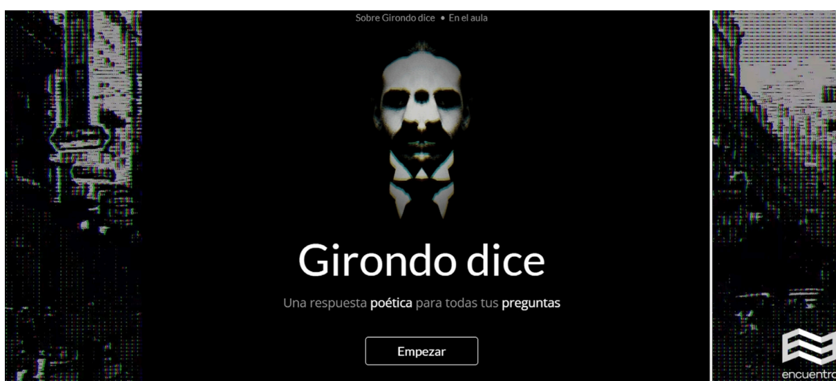
Figura 4 Captura de pantalla micrositio interactivo Girondo Dice

Vivir Juntos ( vivirjuntos.encuentro.gov.ar , URL inactiva) fue un proyecto conjunto del canal, Educ.ar y Unicef que articula televisión e internet, a partir de microprogramas en los que chicas y chicos de entre 6 y 19 años reflexionan sobre temáticas como la amistad, la solidaridad, la equidad, la escuela, la familia y el futuro. 2 El componente web del proyecto permitió no solo ampliar las participaciones a unos 400 testimonios provenientes de todo el país, sino también sumar material especialmente desarrollado para que docentes y familias trabajen sobre la diversidad y la convivencia en la escuela y en el hogar. Durante el gobierno de Cambiemos (2015-2019) se sumó Girondo Dice ( girondodice.encuentro.gob.ar , aún activo), una especie de oráculo que permite a los usuarios hacer preguntas de cualquier tipo y recibir respuestas breves basadas en pasajes de la obra del poeta argentino Oliverio Girondo, de la que se nutre el sistema. El micrositio ofrece además material descargable para trabajar en el aula sobre la obra de este autor.