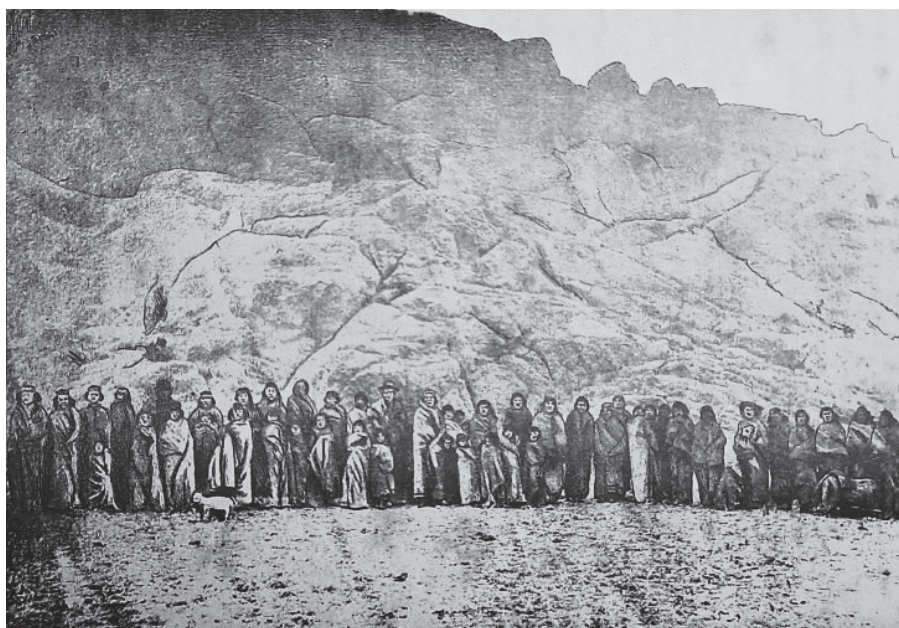
Figura 2. El cacique Orkeke y su grupo o red familiar.

El cacique Orkeke -junto a Casimiro Biguá, Papón y Mulato- fue uno de los principales líderes tehuelches del período. Esta posición lo transformó en interlocutor ante funcionarios, misioneros, militares y exploradores, quienes registraron testimonios acerca de su vida y recorrido como cacique (Musters, [1871] 1964; Lista, 1880; Beerbohm, [1881] 2004; Larraín, 1883, entre otros). Más allá de su destacada presencia entre las crónicas, las principales referencias acerca de Orkeke se asocian a su captura en Puerto Deseado y posterior