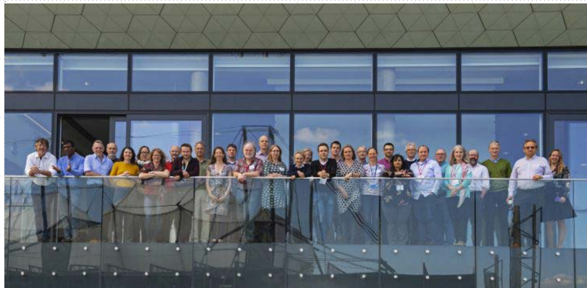
Figura 6. Foto grupal de miembros del proyecto Glaciar Thwaites.

Más allá de las diferencias de las imágenes entre sí, tienen un hilo conductor: en todas, se muestra de forma más o menos explícita, la presencia británica en el Glaciar Thwaites.