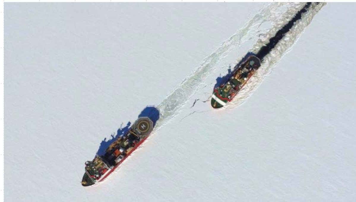
Figura 1. RRS Ernest Shackleton y el HMS Protector en el mar congelado.

En su narrativa, hay lugares que se mencionan y se relacionan. Cuando se habla del proyecto, aparecen, Cambridge en el Reino Unido y el Glaciar Thwaites en la Antártida Occidental. Esto se vincula con la logística, el uso de los buques científicos para recolectar los datos. Lo que resaltan es que se pone a disposición la logística necesaria para realizar las investigaciones. Un ejemplo claro fue en una nota del 14 de enero de 2019 del BAS, en la que aparece en una foto aérea, dos buques británicos en el mar congelado, que incluyó la operación de la fuerza aérea del Reino Unido (BAS 2019a). (Figura 1)