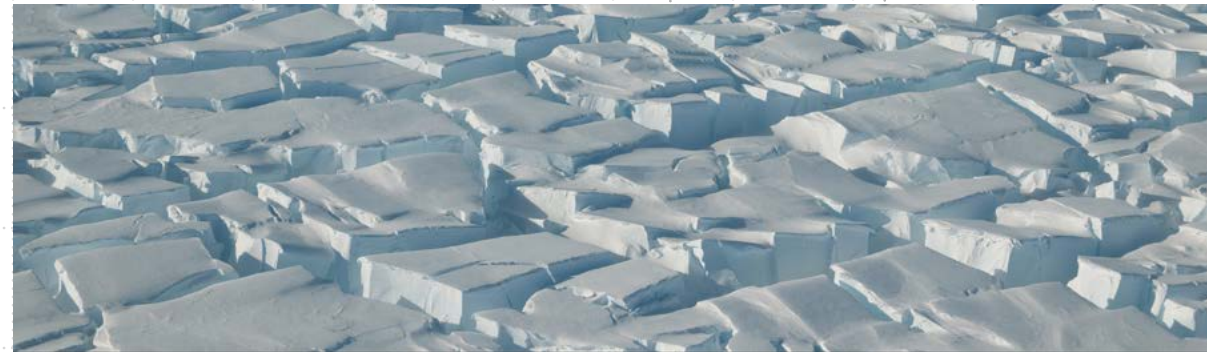
Figura 4. Glaciar Thwaites.

aparece una imagen sobre el Glaciar, tomada desde las alturas, en la que también se resalta el paisaje. Más allá de esto, aparece un dato a destacar: que no fue tomada por la institución británica, sino por el programa antártico estadounidense, el otro socio del proyecto. Esto sugiere el carácter estratégico de la relación y que se trata de un proyecto que se lidera en conjunto (Figura 4)