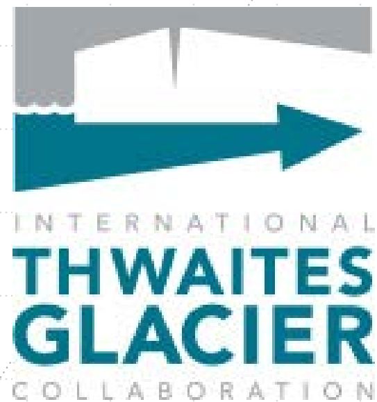
Figura 2. Logo del BAS.

Para comenzar tenemos el logo del proyecto (figura 2), las palabras que figuran muestran en el primer plano el nombre en inglés de Glaciar Thwaites, con esto hace una referencia geográfica específica en la parte occidental de la Antártida, que es donde se desarrollan sus estudios. Al mismo tiempo, en el logo se hace referencia al aspecto humano asociado, la colaboración internacional, que hace a las relaciones con Estados Unidos, y está abierta a otros países. El logo busca sintetizar estas cuestiones en su mensaje. También observamos una flecha hacia la derecha, debajo de un glaciar, con dirección hacia oriente.