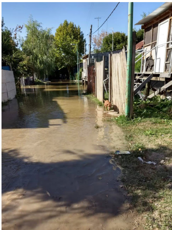
Figura 1. Barrio El Molino, Ensenada.

Para el análisis estadístico comparativo de sexo, edad y factores de riesgo considerados en relación a la presencia de parasitosis intestinales,