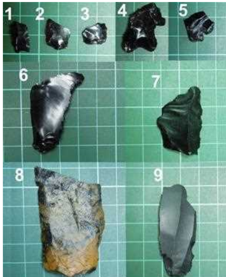
Figura 2. Desechos de talla (1, 2, 3 y 5) y punta de proyectil fragmentada (4) de obsidiana negra recuperados en el curso superior del cañadón El Lechuza. Desechos de talla de obsidiana negra (6, 7 y 9) y sílice (8) del curso inferior del cañadón El Lechuza. El número 9 es una hoja con una intensa abrasión. La roca silícea es similar macroscópicamente a las materias primas presentes en el sur del MD.

En el caso del cañadón Yaten Guajen, la alta frecuencia de desechos de talla puede estar relacionada con su manufactura local, lo que apoyaría la idea del transporte de nódulos de obsidiana negra propuesto para Patagonia (Civalero y Franco, 2003). Sin embargo, la recolección selectiva de artefactos ya mencionada por parte de los habitantes actuales puede influir en un aumento artificial de su porcentaje.