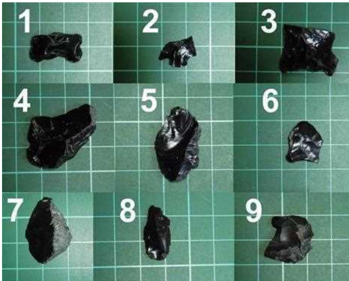
Figura 3. Fragmentos de puntas de proyectil (1, 2 y 3) y desechos de talla (4 y 5) de obsidiana negra recuperados en el curso superior del cañadón Yaten Guajen. Preforma de punta de proyectil (6) y desechos de talla (7, 8 y 9) de obsidiana negra procedentes del curso inferior del cañadón Yaten Guajen.