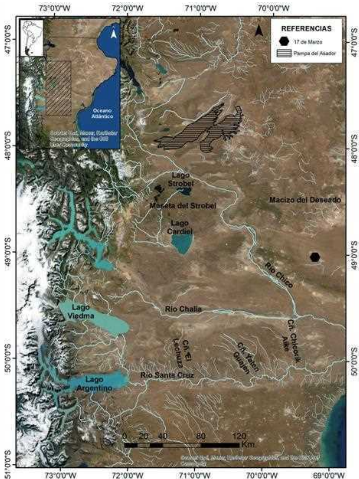
Figura 1. Fuentes de obsidiana y principales cursos de agua y lagos mencionados en el texto.

En cuanto al tamaño de los nódulos de obsidiana, en PDA, la mayoría de los diámetros máximos oscilan entre 40 y 59,9 mm, aunque pueden llegar a variar entre 20 y 100 mm (Espinosa, 2002, en