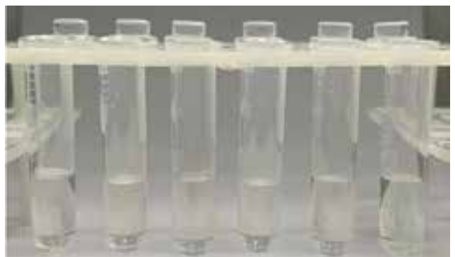
FIGURA 1. Tubos Eppendorf de 2 ml colocados en un portatubos

Se utilizaron cuatro vasos de precipitado estériles en los que se colocó solución de hipoclorito de sodio 2,5%, EDTAC 17%, clorhexidina 2% y SmearOFF (Vista dental). Se colocaron en un portatubos, 60 tubos Eppendorf de 2 ml (Figura 1).