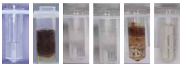
FIGURA 2. Tubos Eppendorf de cada grupo

Los datos obtenidos se arrojaron en una tabla (Tabla 1) y el análisis estadístico se realizó con análisis de varianza (ANOVA) seguido del post test de Neuman Kells con un nivel de significancia de p < 0,5 .