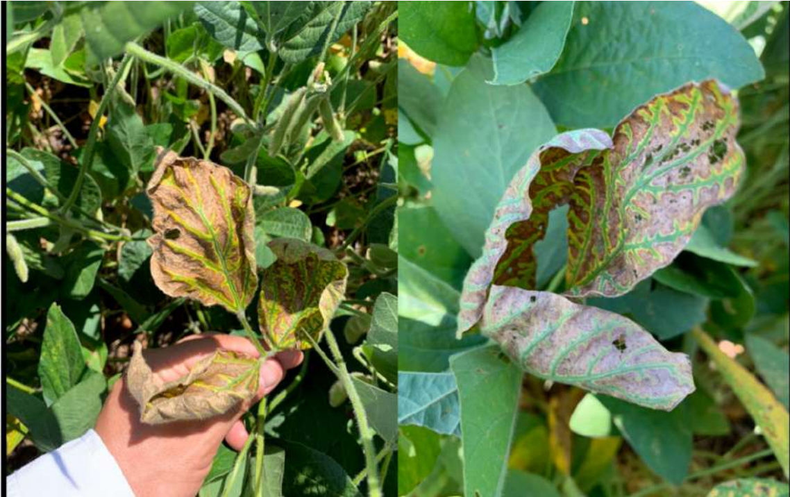
Figura 1. Síntomas de la principal enfermedad que afectó a la raíz y tallo del cultivo de la soja en el NOA durante la campaña 2019/2020: Síndrome de la muerte súbita. Sección Fitopatología, EEAOC.