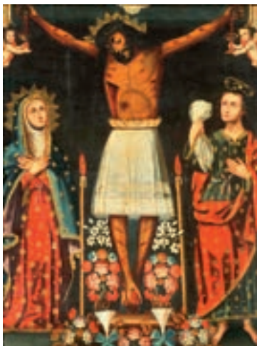
IMAGEN 5. Señor de los Temblores (pintura). El Señor de los Temblores con dos ángeles portadores de cáliz ; Colección Gandarillas. Pontificia Universidad Católica de Chile. Fuente: https://extension.uc.cl/component/k2/item/961-la-proxima-coleccion Consulta: 17.11.2022.