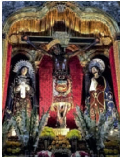
IMAGEN 4. Señor de los Temblores (escultura). Catedral de Cusco. Perú. Fuente: https://andina.pe/agencia/noticia-bendicion-virtual-del-senor-los-temblores-tiempos-coronavirus-791891.aspx Consulta: 18.11.2022.