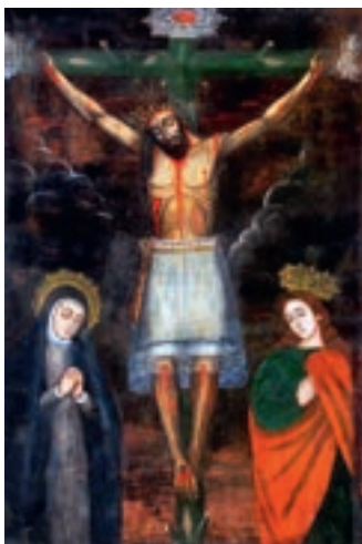
IMAGEN 1. Señor de Sumalao (pintura). Santuario de Sumalao. Argentina.