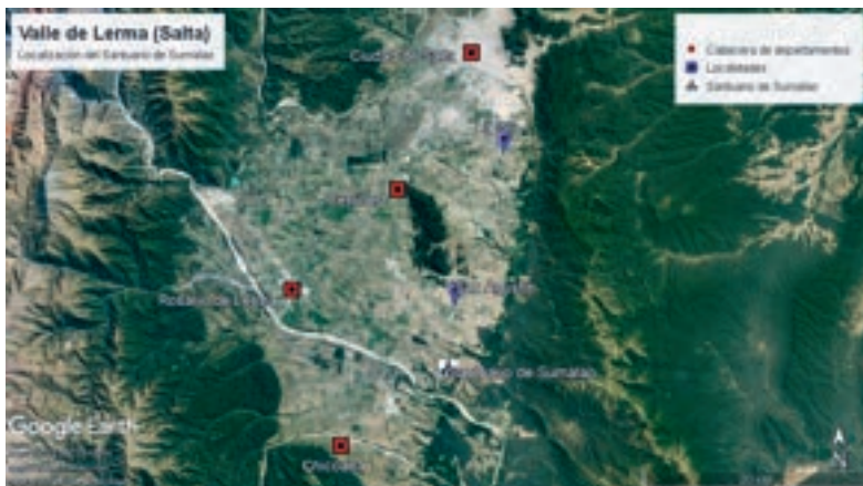
MAPA 1. El Santuario del Señor de Sumalao en el Valle de Lerma, Salta. Elaboración: Facundo Rueda.

Sumalao se insertaba en un ciclo celebratorio andino regional organizado en torno a Cristo. A escala local, los últimos decenios de la centuria XVIII evidenciaron una creciente importancia devocional hacia Jesús Crucificado. Esa devoción crística tuvo también presencia en la ciudad, en la iglesia matriz con el Señor del Milagro y en una ermita en los extramuros, en la zona denominada La Viña, con el Señor de La Viña. Fue en el espacio cultural de la Viña donde también se desarrolló, desde la primera mitad del siglo XIX, el culto al Cristo de Vilque, representado en una escultura. A fines de esta centuria, la imagen de bulto fue reemplazada por una pintura semejante al Señor de Sumalao, al que se denominó sucesivamente Señor de la Salud y luego Señor de la Viña. Con algunas de las advocaciones crísticas del espacio andino, vigentes durante el periodo colonial e independiente, los Cristos de Salta, Sumalao, de la Salud y de la Viña presentan vínculos manifestados en similitudes iconográficas y en redes devocionales.