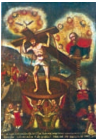
IMAGEN 6. Señor de la Viña (pintura). Parroquia Nuestra Señora de la Candelaria de la Viña. Salta, Argentina.