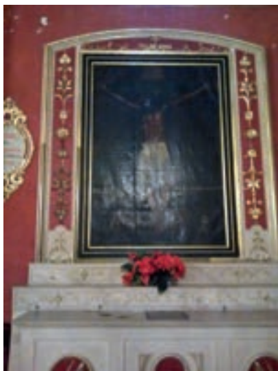
IMAGEN 7. Señor de la Salud (pintura). Parroquia Nuestra Señora de la Candelaria de la Viña. Salta, Argentina.