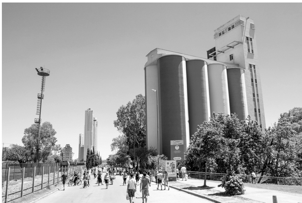
Figura 5. La calle Recreativa. Rosario, noviembre 2019