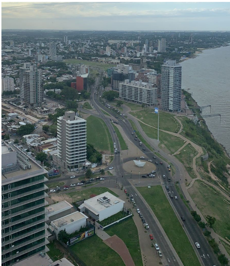
Figura 3. Puerto Norte. Rosario octubre 2021