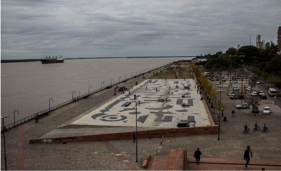
Figura 2. Paseo de la costanera del río Paraná, Rosario, Argentina. Explanada del parque España