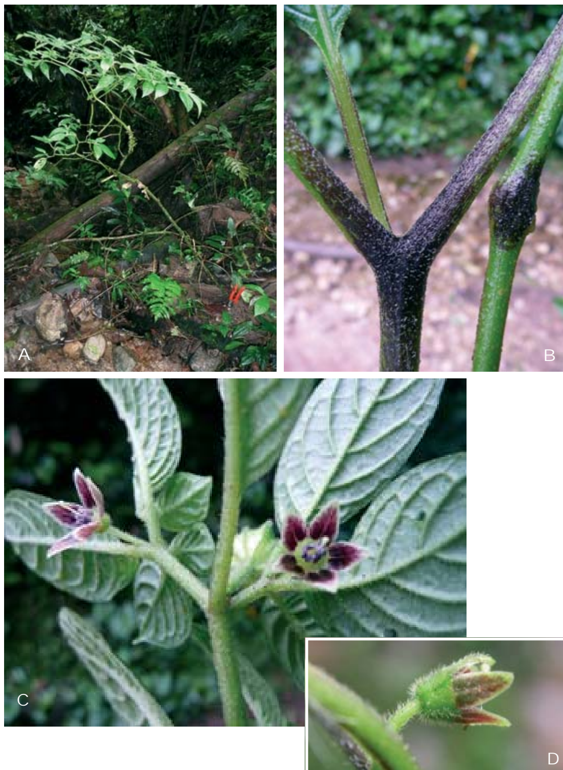
Fig. 2. Larnax altomayense S. Leiva & Quipuscoa. A. Rama florífera; B. Tallos mostrando los nudos; C. Flores en antésis; D. Flor vista lateral (S. Leiva, M.O. Dillon & V. Quipuscoa 4480, HAO).