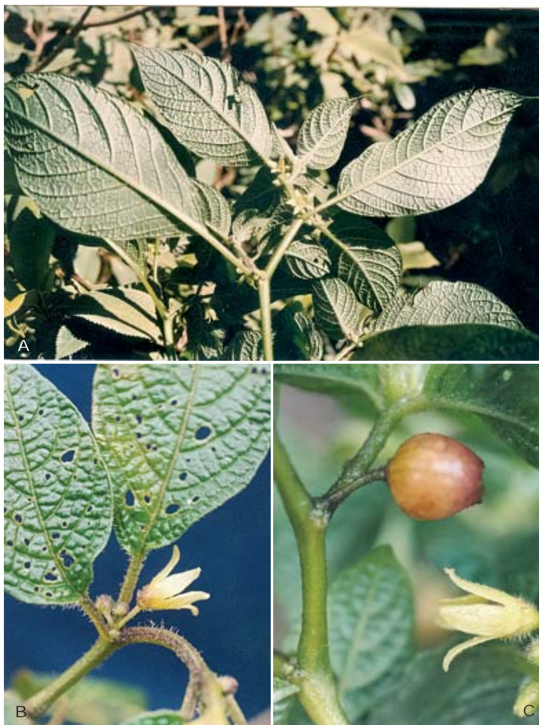
Fig. 4. Larnax chotanae S. Leiva, Pereyra & Barboza. A. Rama florífera; B. Flor en antésis; C. Flor en antésis y baya madura ( S. Leiva & J. Guevara 2283, HAO).