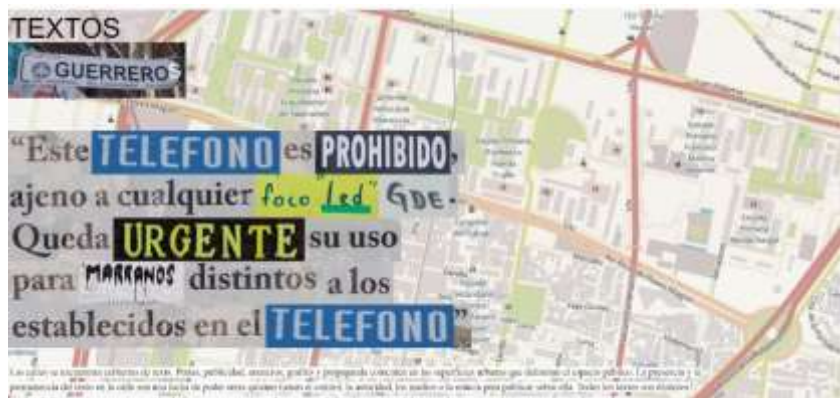
Ilustración 9: Pantalla de Textos Guerreros