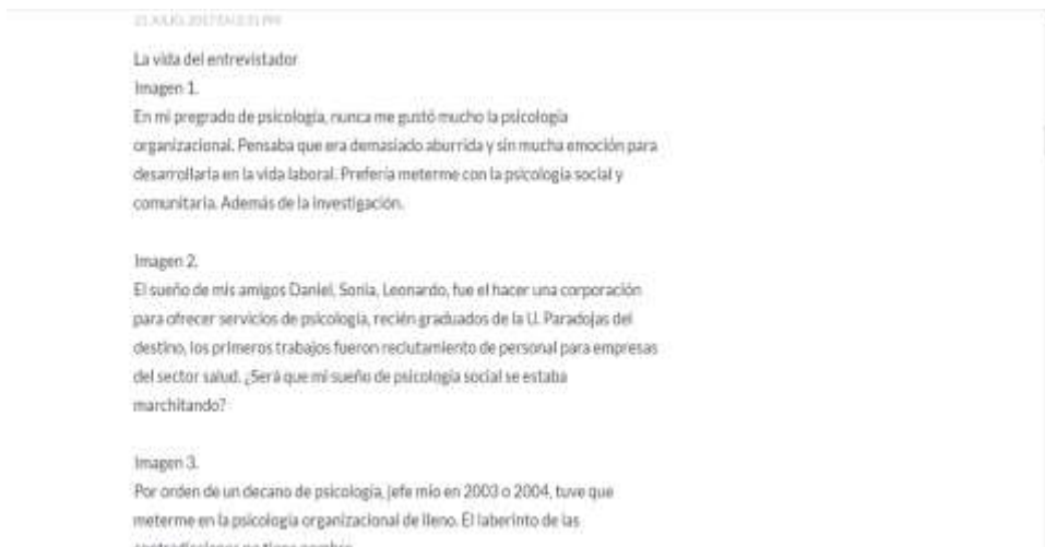
Ilustración 7: Respuestas al blog de Memorias y caminos