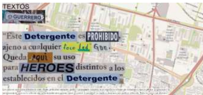
Ilustración 2: Pantalla principal de Textos Guerreros