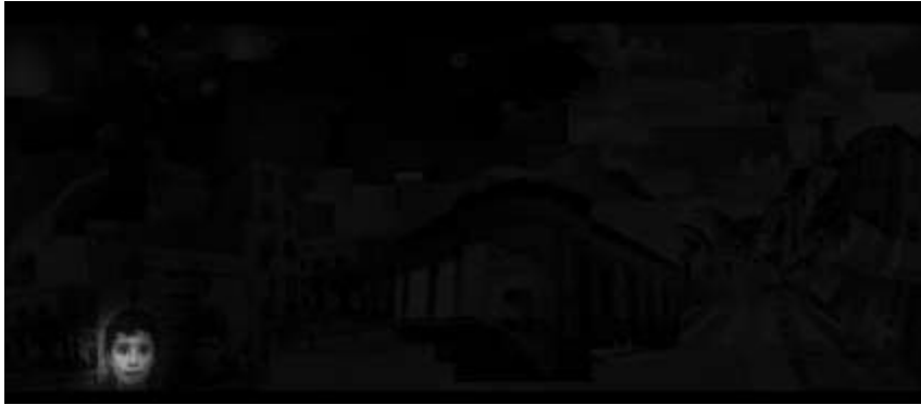
Ilustración 1: Pantalla principal de Memorias y caminos

Fuente: Captura de pantalla de Memorias y caminos (Rodríguez, 2016). Fecha de captura: 16/09/2021.