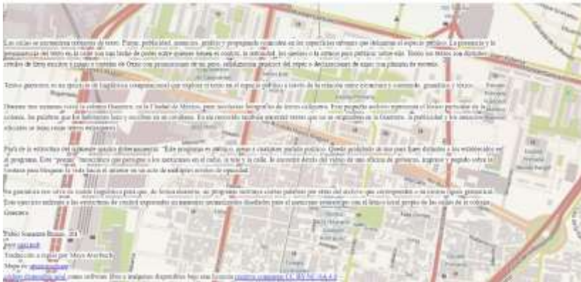
Ilustración 5: Descripción de la pieza Textos Guerreros