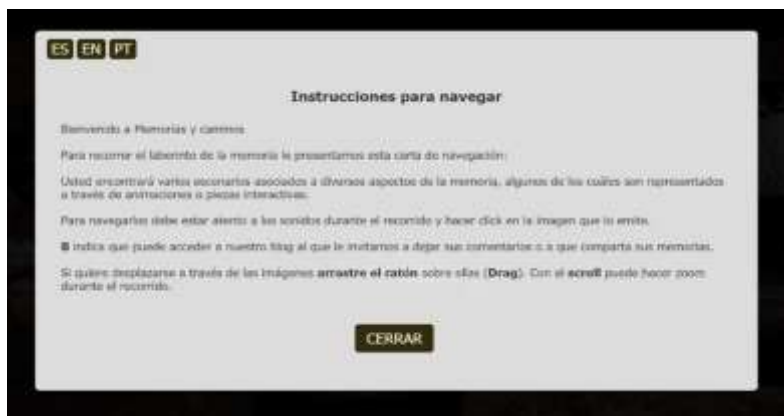
Ilustración 4: Instrucciones para navegar en Memorias y caminos