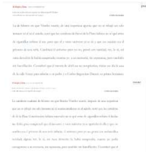
Ilustración 6: Teclas para ejecutar la lectura de El Aleph a dieta