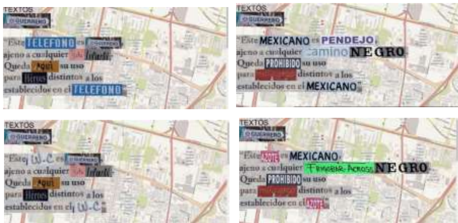
Ilustración 10: Pantalla de Textos Guerreros

Fuente: Capturas de pantalla de Textos Guerreros (Somonte Ruano, 2017). Fecha de captura: 16/09/2021.