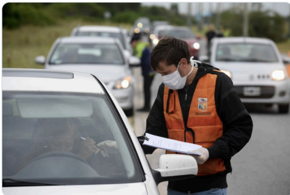
VillaGesellMunicipio y 9 más

1:58 p. m. · 29 jun. 2020 · Twitter Web App