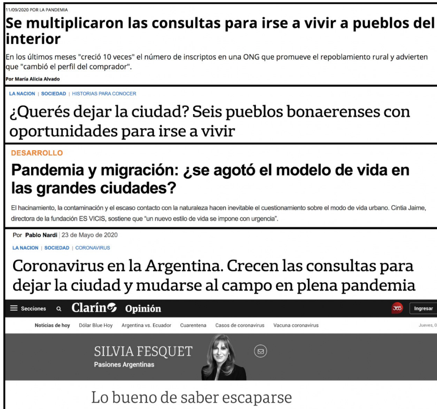
Figura 3. Control de los bordes municipales

Este renovado imaginario territorial, reforzado por la posibilidad del teletrabajo y el temor a nuevos confinamientos, aceleró el interés residencial en áreas rurales y ciudades de menor escala. Algunos agentes inmobiliarios e investigadores (Greene et al., 2020) comenzaron a hablar de 'coronaéxodo' para referirse a este movimiento. El anhelo fue especialmente poderoso en profesionales jóvenes de clase media y alta, quienes durante meses calcularon presupuestos, evaluaron costos y beneficios y consultaron valores de propiedades lejanas (Bontempo, 2020); algunos/as se aventuraron, finalmente, a mudarse.