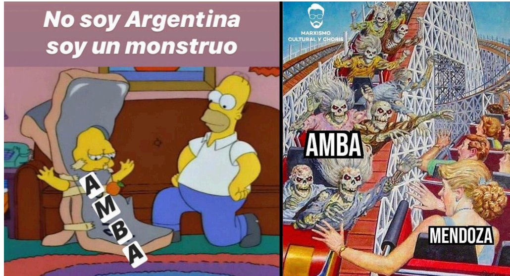
Figura 2. Memes sobre la enfermedad del AMBA

Nota: A la izquierda: meme sobre el AMBA (“La cuarentena se levantó...”, 2020). A la derecha: meme sobre la tasa de contagios (marxismoychoris, 2020).