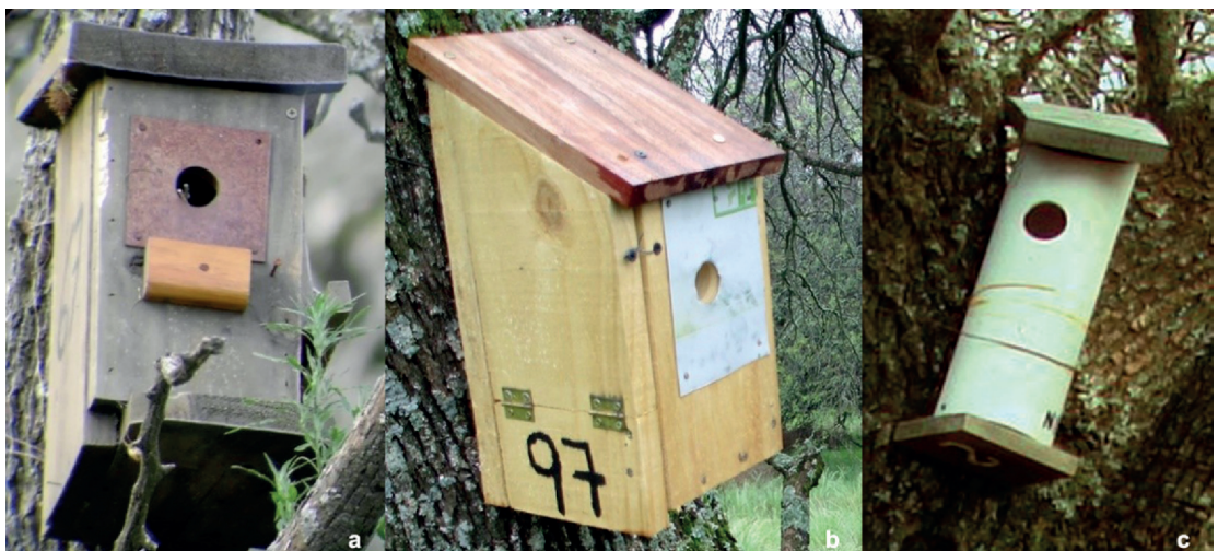
Figura 2. Cajas nido colocadas en troncos de árboles de caldén desde las temporadas reproductivas 2010-2011 a 2012-2013 en el establecimiento "La Tapera", provincia de La Pampa, Argentina. Las mismas fueron construidas con diferentes materiales a) madera de caldén, b) madera de pino c) PVC con tapas superior e inferior de madera de caldén.