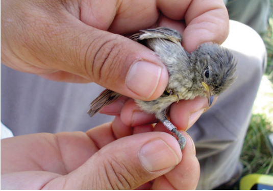
Figura 3. Pichón de Coludito Copetón anillado a los 12 días de vida, en el establecimiento "La Tapera", provincia de La Pampa, Argentina.

en el laboratorio de la Facultad de Agronomía de la UNLPam. También se anilló a los pichones siguiendo procedimientos estándar (North American Banding Council y Fish and Wildlife Service 2003), usando anillos metálicos provistos de un código alfanumérico y dirección de remito correspondiente al Centro Nacional de Anillado de Aves (CNAA, Instituto Miguel Lillo, Tucumán). Finalmente, se los devolvió a su caja nido correspondiente.