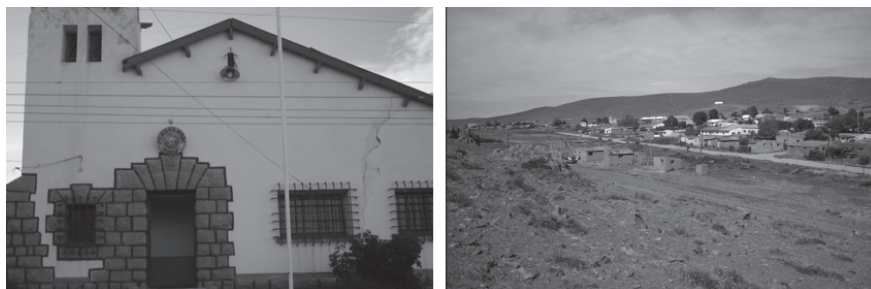
Figura 5. Comisaría y pueblo de Mencue (2010).