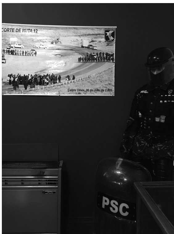
Figura 8. Gigantografía.