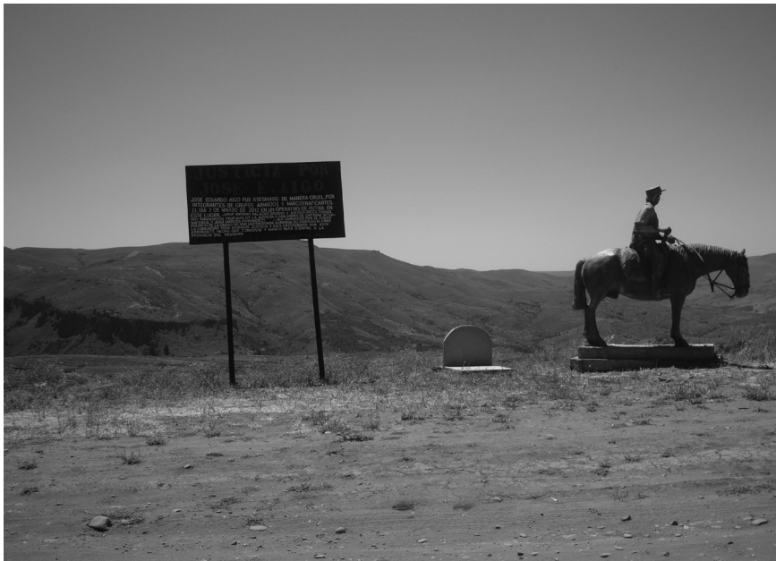
Figura 2. Memorial del sargento J. Aigo.