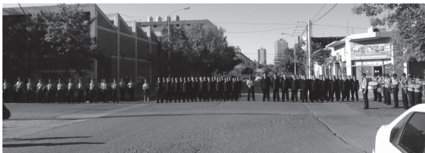
Figura 1. Inauguración del museo “Comisario Inspector Luis F. Dewey” diciembre del 2011. Neuquén.