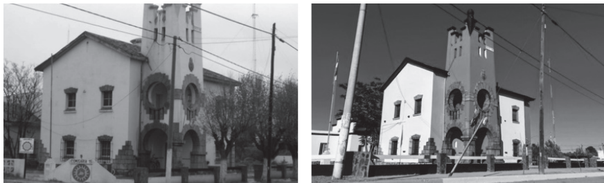
Figura 6. Comisaría de Valcheta (2015 y 2019).