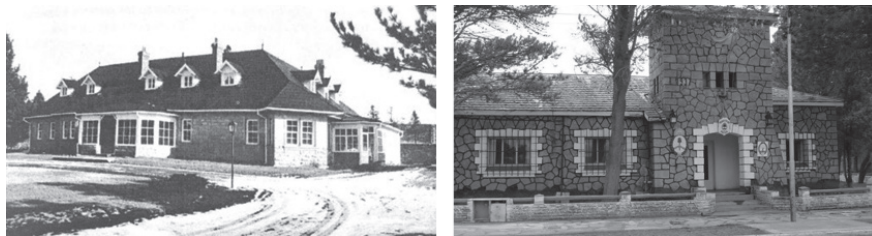
Figura 3. Estancia Pilcañeu (c. 1940) y Comisaría de Pilcaniyeu (2016).

Fuente: A la izquierda: Liliana Lolich. “Estancia Pilcañeu”, Habitat e inmigración. Nordeste y Patagonia , Ramón Gutiérrez et al. (Buenos Aires: Fundación Cedodal / Instituto de Investigaciones Geohistóricas. conicet, 2007): 171. A la derecha: Foto de la autora, “Comisaría de Pilcaniyeu”. Trabajo de campo, 2016.