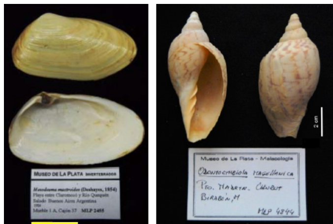
Figura 2. Ejemplos de especies de moluscos nativos del Mar Argentino. Colección malacológica del Museo de La Plata. Izquierda: Almeja amarilla ( Amarilladesma mactroides ). Derecha: Un gasterópodo ( Odontocymbiola magellanica ) del sur de América del Sur.

En un trabajo recopilatorio realizado por Bigatti y Signorelli (2018) en más de 8.000 km del Mar Argentino, han encontrado 862 especies descritas de