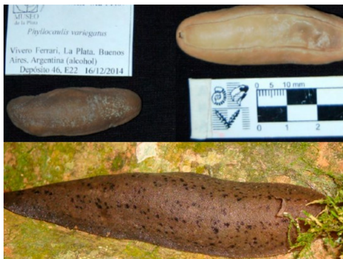
Figura 3. Ejemplos de especies de moluscos nativos terrestres de Argentina. Colección malacológica del Museo de La Plata. Las babosas ( Phyllocaulis variegatus ) como hospedadores intermedias de helmintos de importancia sanitaria. Izquierda: El caracol Heleobia parchappi y su rol en la dermatitis humana. Derecha: Un caracol muy argentino ( Chilinas iguazuensis ).

moluscos. Si bien (por modelos teóricos) se espera que las especies representadas fueran al menos el doble de lo encontrado, se estima que este bajo número se debe a: