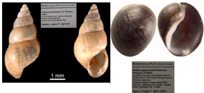
Figura 4: Ejemplos de especies de moluscos nativos dulceacuícolas de Argentina. Colección malacológica del Museo de La Plata. Izquierda: El caracol Heleobia parchappi y su rol en la dermatitis humana. Derecha: Un caracol muy argentino ( Chilinas iguazuensis ).

Los Moluscos terrestres son uno de los grupos de Moluscos más diversos. Algunas listas regionales de especies mencionan a Brasil y Perú como lugares donde se encuentra la mayor riqueza de especies y en Colombia y Ecuador la mayor diversidad filogenética (Dos Santos et al., 2020). Argentina es un área excepcional para el estudio de relaciones entre la fauna y factores abióticos, debido a su heterogeneidad de ambientes, en este caso los terrestres. La variedad ambiental va desde ambientes de alta montaña a llanuras, de selvas a desiertos. Estas características