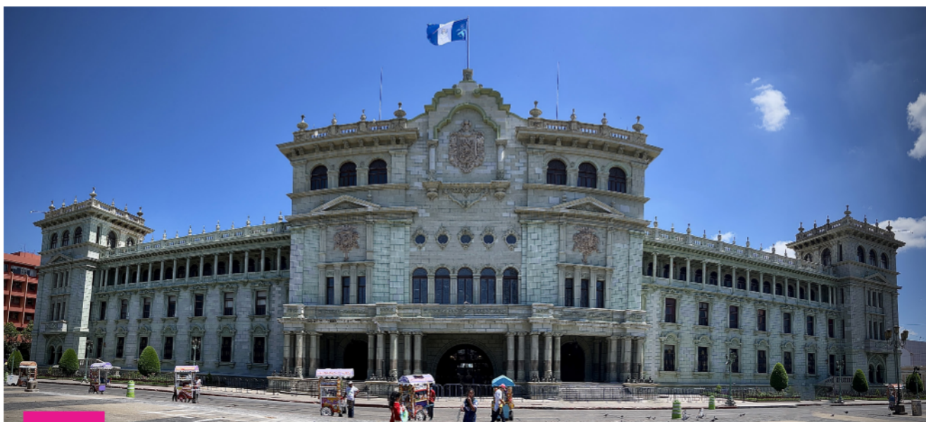
Fotografía: Lcdo. Javier Corleto, abril 2022.