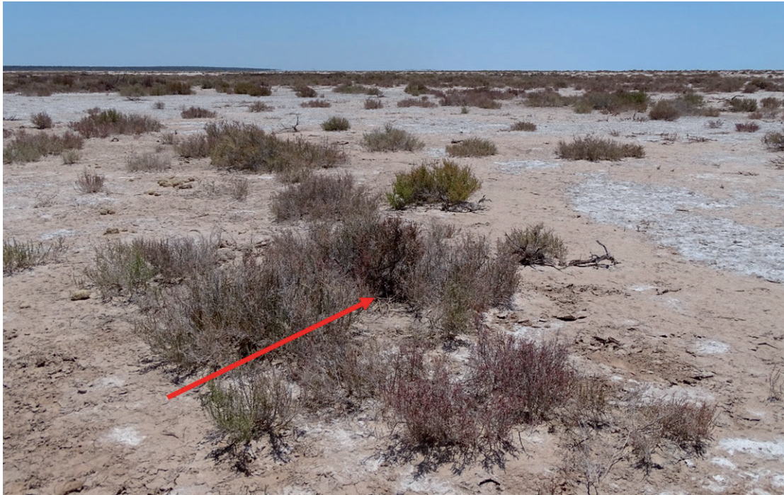
Figura 2. Ambiente y ubicación del nido de Xolmis salinarum con dos pichones.

Figure 2. Environment and location of the nest of Xolmis salinarum with two chicks.