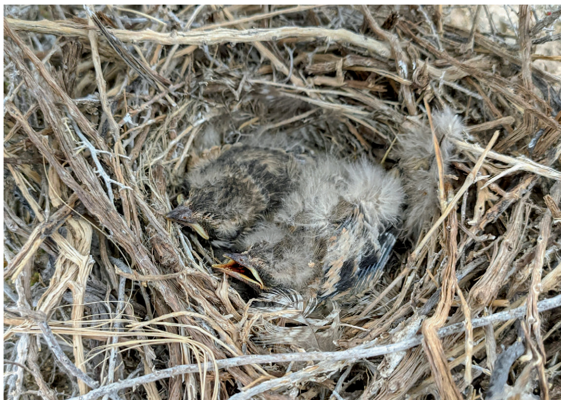
Figura 4. Pichones de Xolmis salinarum a los siete días del hallazgo. El de la derecha, con más plumón, se hallaba sin vida.

Figure 4. Xolmis salinarum chicks seven days after being found. The one on the right, with more down, was lifeless.