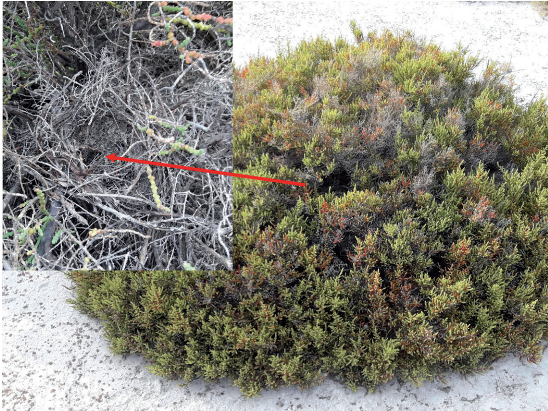
Figura 5. Nido abandonado, atribuible a Xolmis salinarum .