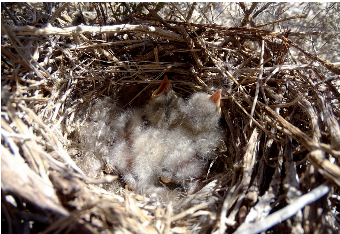
Figura 3. Pichones de Xolmis salinarum , donde se aprecia el color del plumón, picos y patas.

Figure 2. Environment and location of the nest of Xolmis salinarum with two chicks.