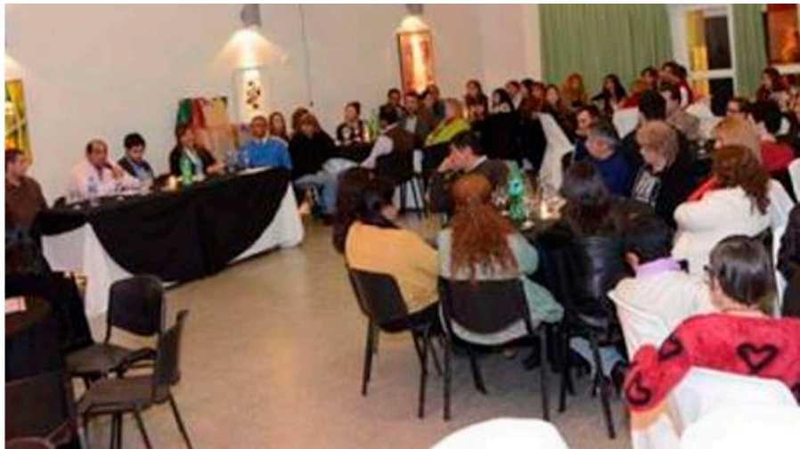
Fotografía N° 1. Acto de asunción de Ponce