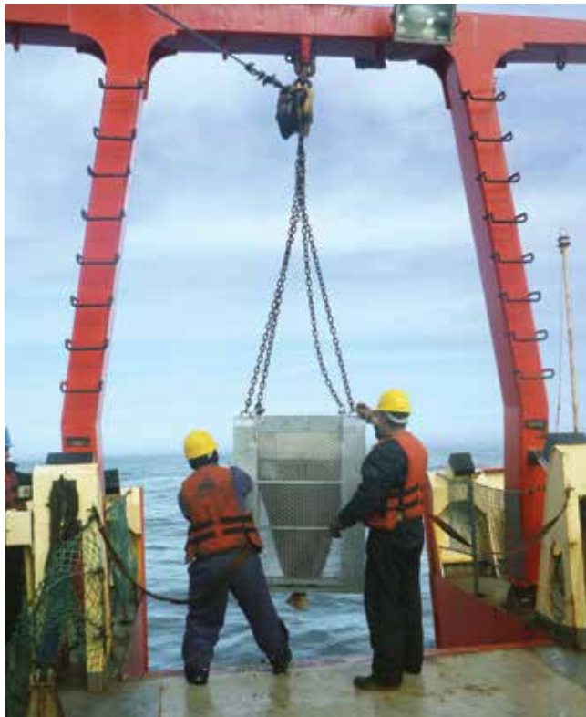
Rastra en el momento de ser izada a bordo.

Las profundidades son el hábitat preferencial de los erizos de mar cidaroides, provistos de un cuerpo robusto y de grandes y gruesas espinas cubiertas de organismos que viven sobre ellas. Más raros y con su cuerpo exclusivamente modelado por las condiciones de presión y la baja concentración de calcio son los equinotúridos. A diferen-