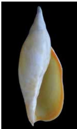
Gasterópodo de la especie Zidona palliata , endémico del Atlántico Sur, coleccionado a 990m de profundidad. Mide unos 8cm de alto.