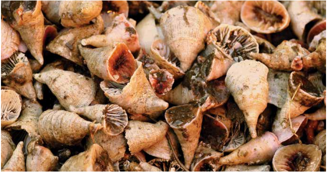
Existen fondos marinos dominados por corales duros, como estos del género Flabellum , obtenidos en un exitoso lance de pesca a unos 540m de profundidad; cada uno mide unos 5cm.

la Patagonia, Tierra del Fuego y la Antártida. Cada una de las tres campañas indicadas, exploratorias de las profundidades, tuvo una duración cercana a las dos semanas y llevó a bordo cerca de treinta especialistas en temas como los mencionados.