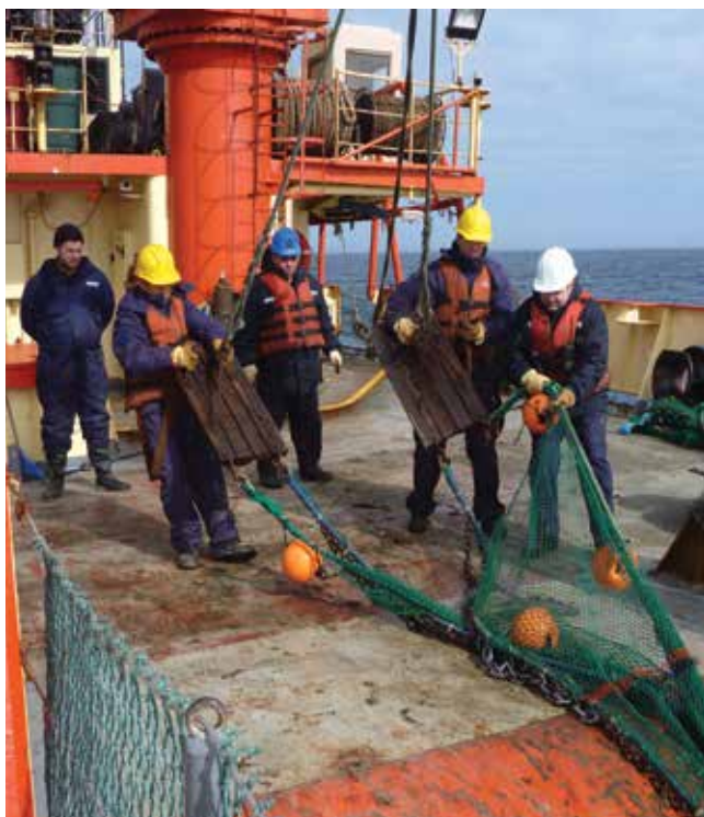
Red piloto instantes antes de ser lanzada.

cia del resto de los erizos, cuyo cuerpo es rígido, no tienen soldadas entre sí las placas calcáreas que lo cubren, por lo cual, cuando se los saca fuera del agua, parecen aplastados y dañados. De ahí su nombre común de erizos panqueque. Fueron primero descritos como fósiles a fines del siglo XIX y se creían extinguidos. En las campañas del Puerto Deseado al talud se coleccionaron varios ejemplares de especies vivientes a más de 3000m de profundidad que están en proceso de estudio y descripción.