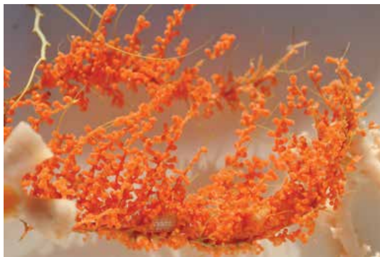
Fragmento de unos 15cm de ancho de coral blando primnoideo creciendo sobre un coral duro blanco de la especie Bathellia candida .

El grupo de los cnidarios incluye formas muy diferentes entre sí, como las anémonas de mar, las medusas y los corales.