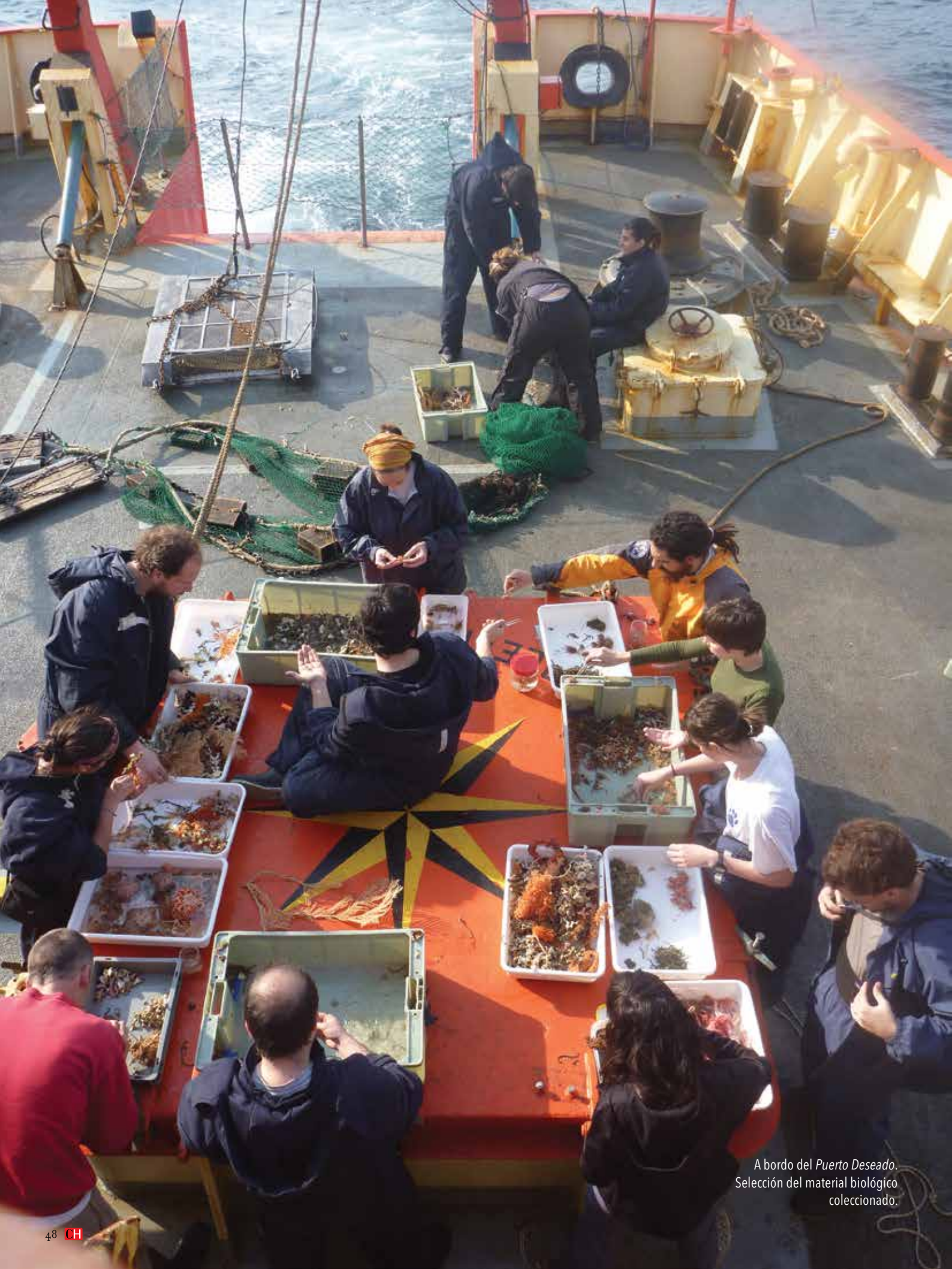
A bordo del Puerto Deseado. Selección del material biológico coleccionado.