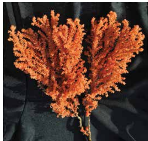
Coral blando primnoideo arborescente del género Thouarella , de unos 20cm en su mayor ancho.

época en que el mundo biológico parece haber visto y hecho todo, estas incursiones a menos de doce horas de la costa permiten repensar los parámetros de biodiversidad del Atlántico Sur. Como consecuencia, no es temerario suponer que la disminución de la biodiversidad marina que se advirtió desde el norte del Brasil hasta la región magallánica sea solo válida para las áreas costeras.