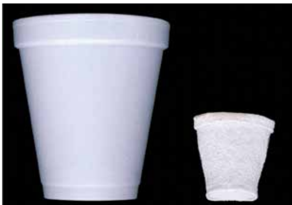
Efectos de la presión a 1500m de profundidad sobre un vaso de telgopor.

Los organismos que habitan las profundidades están adaptados a soportar grandes presiones, que constituyen la mayor diferencia ambiental con la superficie, aparte de la ausencia de luz. A 3000m de profundidad la presión es unas 300 veces mayor que la atmosférica, ya que la presión aumenta a razón de una atmósfera cada 10m de profundidad. Este concepto es sencillo de comprender racionalmente pero resulta difícil imaginar sus efectos. El vaso de telgopor de la izquierda quedó reducido a la mitad de su tamaño cuando fue recuperado de una rastra que se había hecho descender a la profundidad de 1500m. Verlo permite entender por qué prácticamente todos los organismos coleccionados por debajo de esa profundidad llegan muertos a la superficie, aunque algunas veces, si la subida se realiza en forma muy paulatina para que el cambio de presión sea gradual, unos pocos llegan con vida.