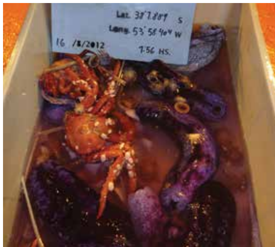
Materiales recién salidos de la rastra y en espera de acondicionamiento, coleccionados a 1600m de profundidad. Se destacan, en rojo, una centolla, y de color violáceo, unos pepinos elaspódidos recientemente descubiertos.