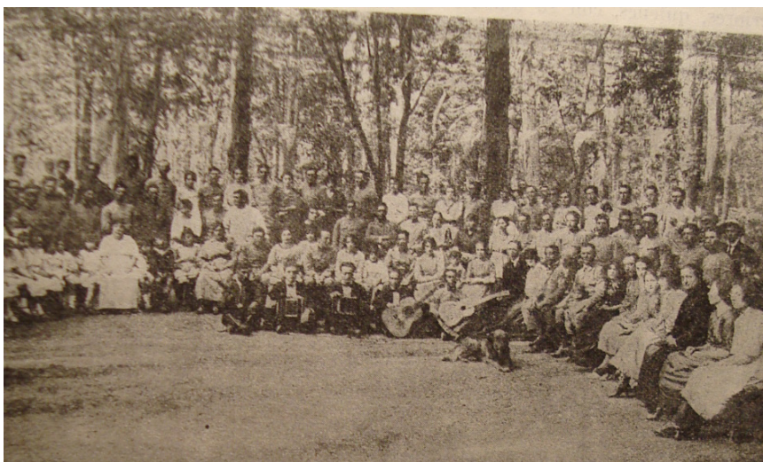
Imagen N 3. Reg. 10 de Caballería, Campo de Mayo. Imagen de una “cacería y picnic familiar” del grupo de Suboficiales y sus familias.