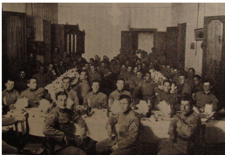
Imagen N 2. Nochebuena de 1922. Banquete que los suboficiales del R. 10 obsequiaron a sus camaradas del C. 3