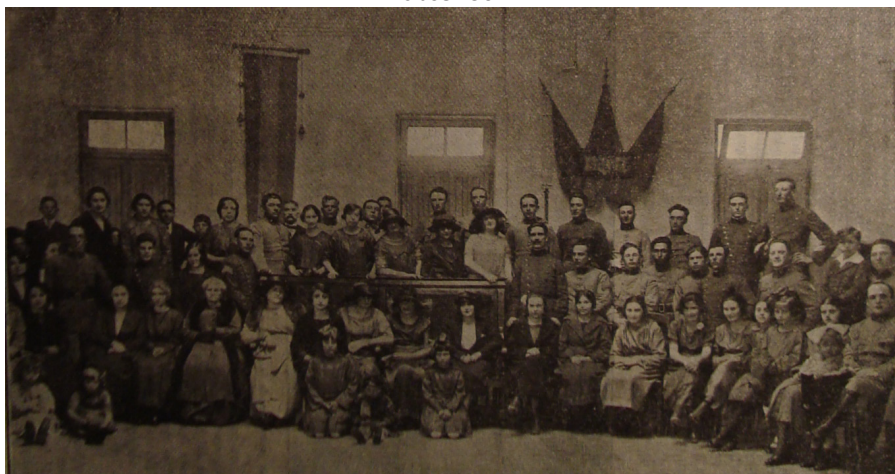
Imagen N 1. 28 de septiembre de 1922. "Fiesta social" en el casino de Suboficiales del R. 6 de infantería, con motivo del Juramento a la Bandera realizado por los conscriptos de clase 1901