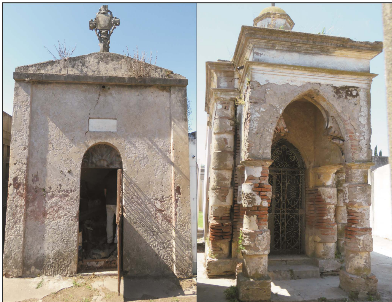
Figura 2. Bóvedas en las cuales se encontraban los restos recuperados

Originariamente, el Cementerio Municipal ocupaba un área de 150 m de ancho por 100 de largo aproximadamente, y en el camino principal se ubicaban las bóvedas pertenecientes a las familias más destacadas de la ciudad, algunas de las cuales aún se mantienen en pie (Figura 2), así como también varias sepulturas y mausoleos de inmigrantes españoles, italianos e irlandeses, manifestaciones arquitectónicas y simbólicas de gran importancia para el acervo patrimonial histórico de la ciudad y sus habitantes. Hacia la mitad del sendero se destaca aún hoy día la Cruz Mayor, que presenta diversos símbolos masónicos, y en uno de sus extremos se emplaza el Osario General, que originalmente correspondió a la sepultura del reconocido gaucho Juan Moreira [60].