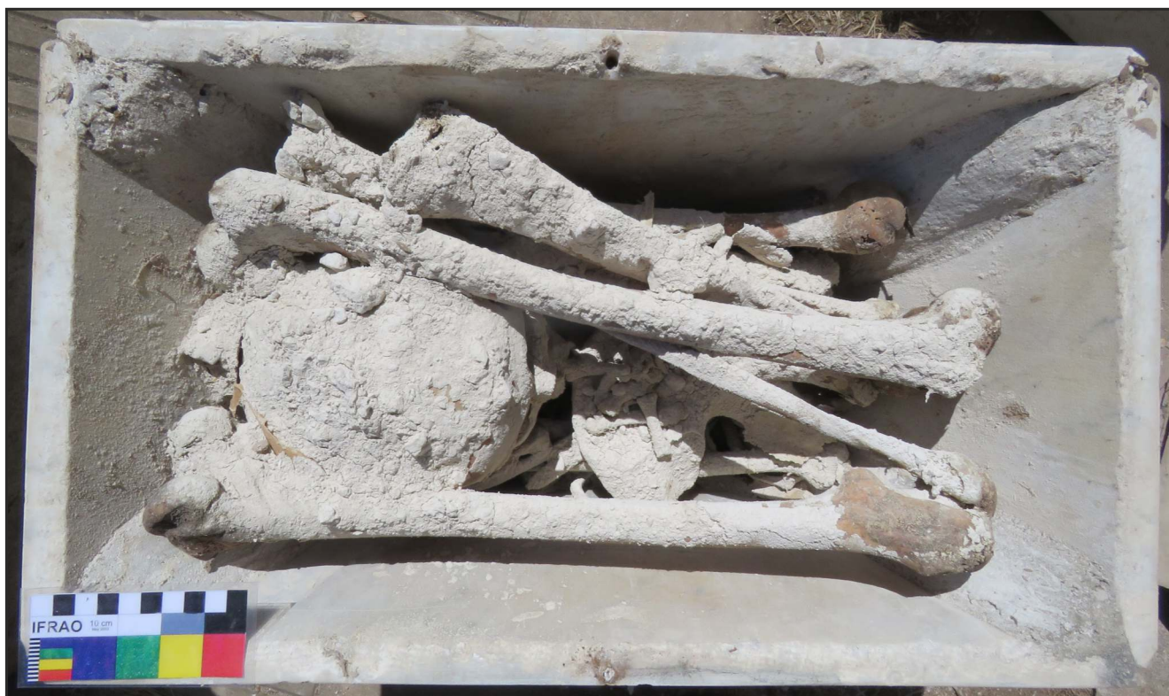
Figura 5. Aplicación de cal sobre los restos óseos.

Las actividades de laboratorio se han focalizado en la implementación de un plan integral de manejo que prioriza en el tratamiento de los restos humanos desde los principios de la bioética, los cuales establecen que los investigadores de campos disciplinares como la bioarqueología, la antropología biológica y la paleopatología tienen la responsabilidad de preservar y registrar los restos mortales para investigaciones futuras, ya que ofrecen información única e insustituible sobre la historia de la humanidad [63, 66]. Por ese motivo, una premisa central del equipo de investigación es la generación y reproducción de una actitud que privilegie el manejo respetuoso y la preservación de la identidad de los individuos [67], así como la implementación de un programa de conservación tanto curativa como preventiva que consta de los siguientes pasos: 1) ventilación de los restos para eliminar la humedad; 2) documentación fotográfica de todo el proceso, desde la apertura de la caja de transporte hasta las etapas de limpieza y guarda definitiva; 3) toma de muestras de sedimento, puparios (Figura 6), uñas, restos de cal y cabello, etc; 4) limpieza mecánica con cepillos de diferente dureza; 5) tratamiento con agua destilada en los