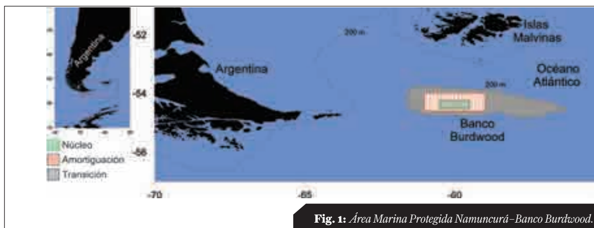
Fig. 1: Área Marina Protegida Namuncurá-Banco Burdwood.

termareal o submareal con las aguas que la cubren, y su flora, fauna y características históricas y culturales asociadas, reservada por ley u otro meca-