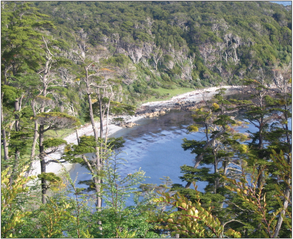
1. Vista de un bosque andino austral.

a cuatro familias: las nothofagáceas (ñires, lengas, coihues, guindos, todos del género Nothofagus ), las cupresáceas (alerce, ciprés de las guaitecas y ciprés de la cordillera), las araucariáceas (pehuén) y las podocarpáceas (como el mañío hembra y mañío macho). Las nothofagáceas, araucariáceas y podocarpáceas son predominantemente del hemisferio Sur y han sido emblemáticas para la ciencia y objeto de estudio para los biólogos y biogeógrafos desde exploraciones botánicas como las de Joseph D. Hooker y Charles Darwin durante el siglo XIX.