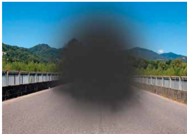
Efecto en la vista del deterioro de la visión frontal causado por la enfermedad macular.

La presencia de células madre ha sido verificada en casi todos los organismos multicelulares, incluidas las plantas. En los mamíferos, se ha constatado su presencia en