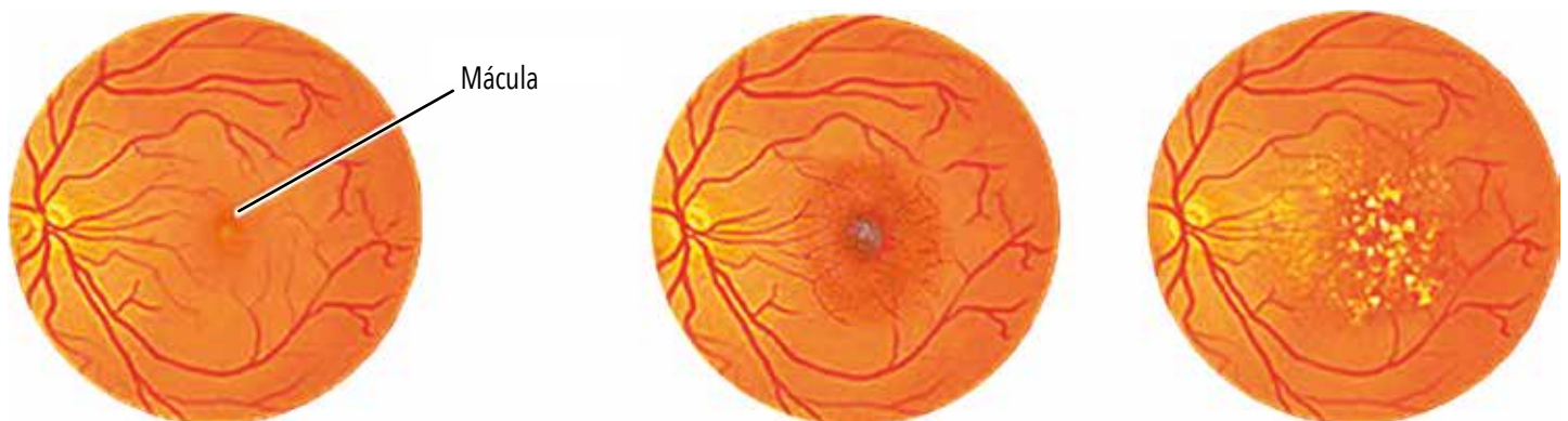
Retina sana (izquierda), comparada con dos formas de degeneración macular, llamadas húmeda (centro), que deteriora la visión frontal en semanas, y seca, que lo hace lentamente a lo largo de varios años. Los tratamientos experimentales con células madre procuran sustituir las células maculares deterioradas.