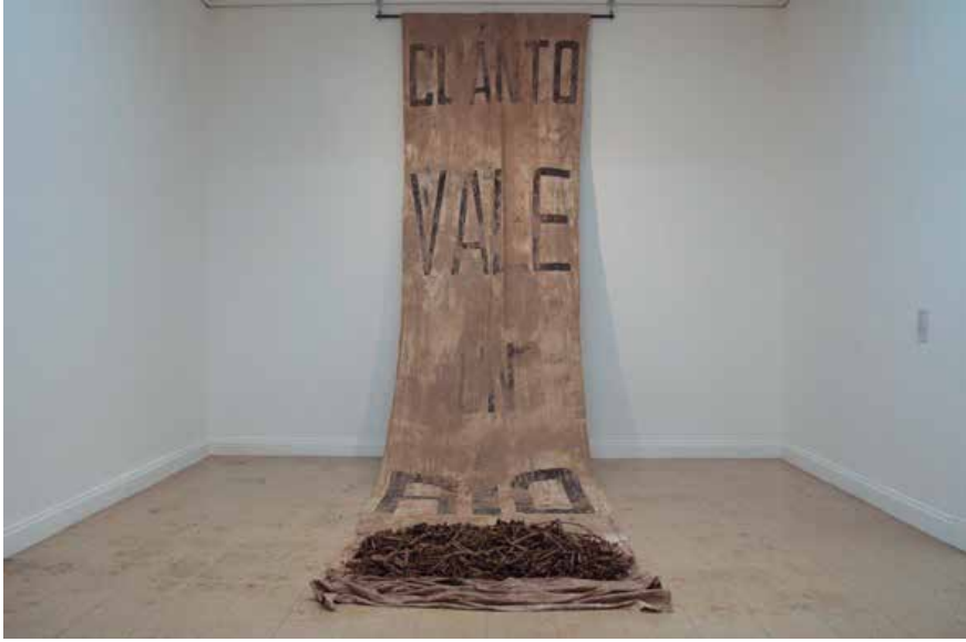
La bajante del Colectivo Thigra, en exhibición en el 98º Salón Anual Nacional de Santa Fe en el Museo Rosa Galisteo.