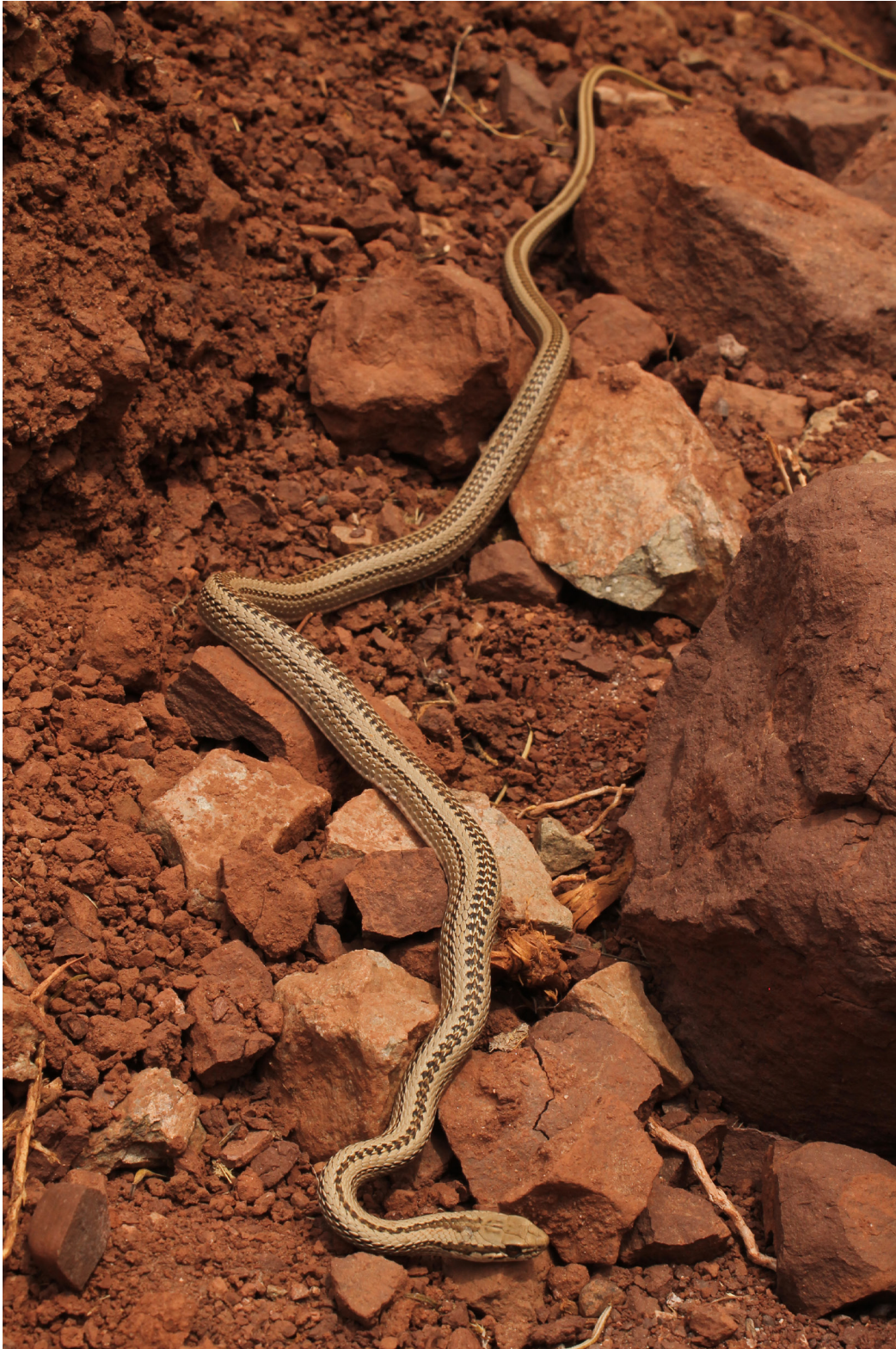
Figure 2. Specimen found of Philodryas psammophidea in the Precordillera of the Jáchal Department, San Juan, Argentina.