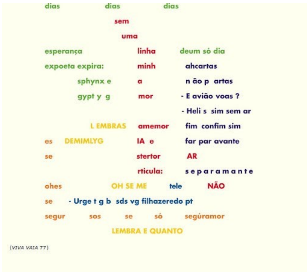
FIGURA 4. Poema de Augusto de Campos