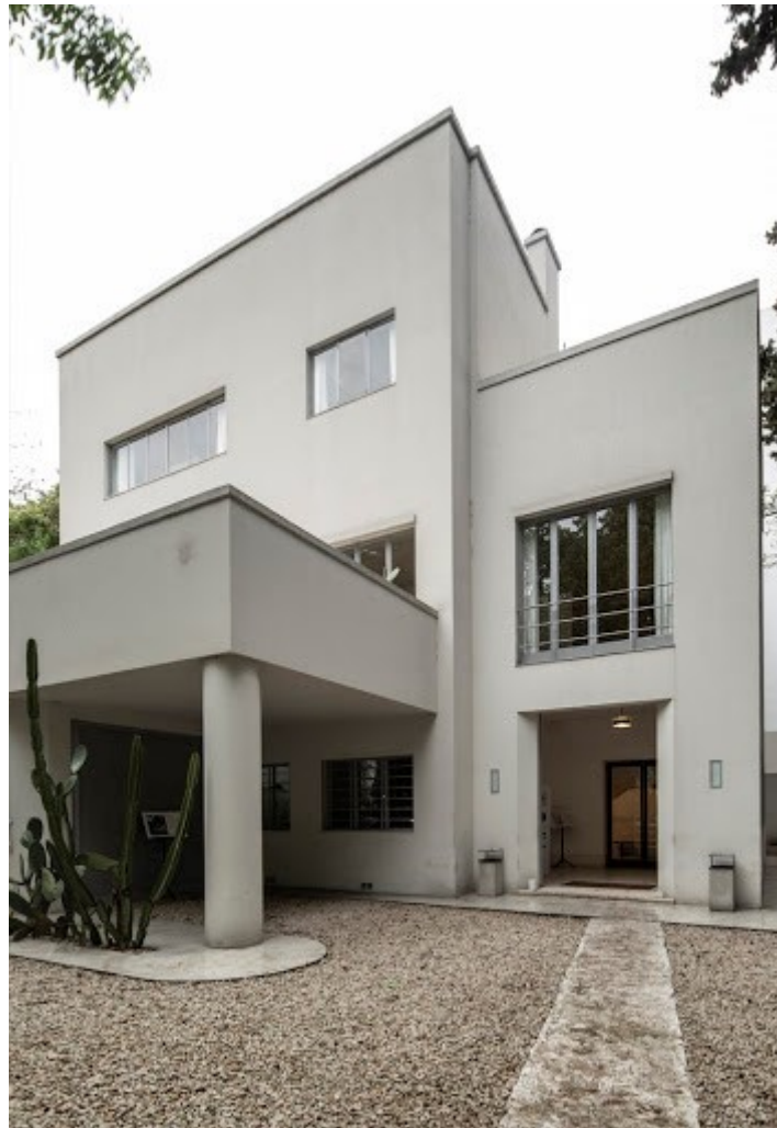
FIGURA 2. Detalle de la fachada de la Casa de la Cultura