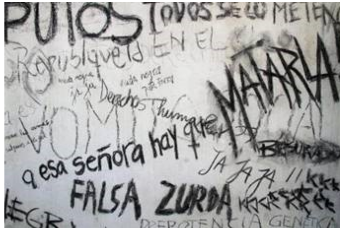
FIGURA 3. Detalle de Diarios del odio