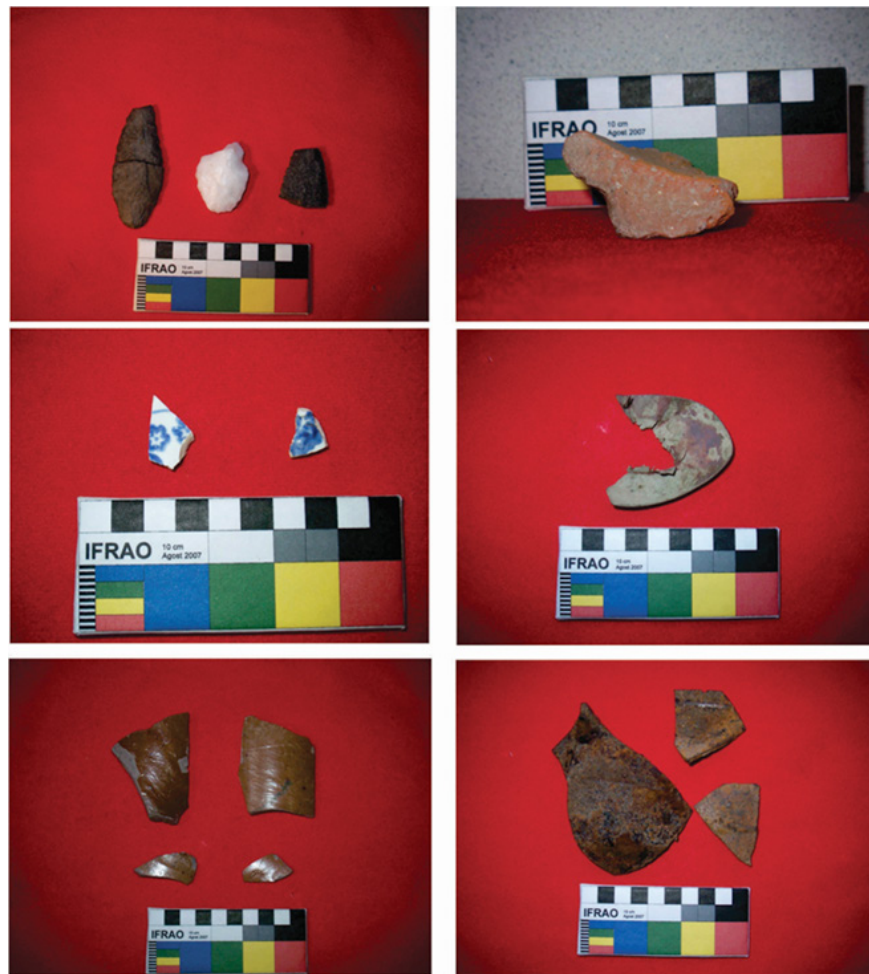
Figura 2. En la imagen se puede apreciar los materiales recuperados. De izq. a der. y de arriba hacia abajo, podemos apreciar puntas de proyectil líticas, cerámica arqueológica, loza, bronce, gres y hierro.

En síntesis, podríamos decir que: a- el análisis de la ergología recuperada nos ha permitido identificar una dinámica poblacional que abarca los períodos de caza y recolección, agroalfarero temprano y medio, hasta llegar al Colonial; b- el análisis bibliográfico y documental no reveló en forma directa la presencia de naturales encomendados a la merced de Niquixao , pero si, el usufructo por arrendamiento de los naturales destinados a Nuño Beltrán (h). Y por último, c- el análisis de los tipos cerámicos evidenció la presencia en la zona de grupos pertenecientes a la tradición chaco-santiagoños (tonocotés), los que eran tributarios de Pomancillo y explotados por Esquivel en Niquixao (Figura 3).