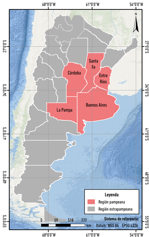
Figura 1. Mapa de la región pampeana, Argentina. Datos: IGN (2018).

del territorio pampeano, no es la única que lo compone. Sin embargo, optamos por abordar solo esta provincia tanto por cuestiones “operativas” para la realización del trabajo de campo, como porque es un espacio representativo de las diversas variantes productivas, sociales y económicas de la región (Barsky y Pucciarelli 1991).