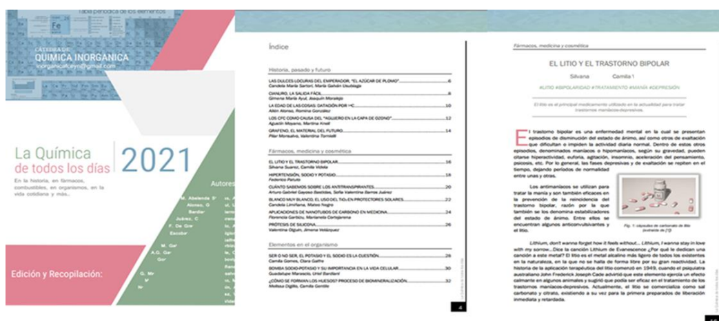
Figura 3. Portada, índice y parte de uno de los textos producidos en el documento compilado, disponible en https://bit.ly/3aqbhYn

Los textos se compilaron en un documento único de 46 páginas con 37 autores que se publicó bajo licencia Creative Commons-BY-NC 4.0. La edición general estuvo a cargo de las docentes, autoras de este trabajo. Cuenta con una portada, un índice, un prólogo y luego los textos, con una longitud de dos páginas por tema ordenados en las 5 secciones ya mencionadas. Se encuentra accesible a través del link: https://bit.ly/3aqbhYn o escaneando un código QR.