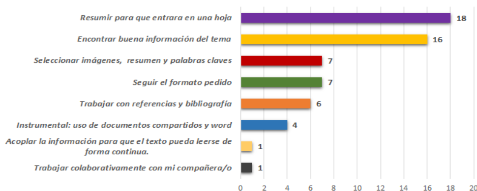
Figura 2. Principales dificultades encontradas en los estudiantes al realizar la actividad de evaluación (n=29 estudiantes encuestados).

Al indagar al estudiantado y en función del análisis realizado por el equipo docente acerca de la mayor dificultad encontrada en el trabajo evaluativo, la opción elegida fue "resumir el texto para que entrara en una hoja" (18 respuestas), como se puede observar en la Figura 2. La segunda opción fue encontrar "buena información" (con fundamentos científicos) sobre el tema asignado (16 respuestas), lo que deja en evidencia la necesidad de enseñarles a construir criterios para realizar las búsquedas (Maggio, 2016). Relacionado con esto, pero en menor medida, se identificaron problemáticas como: seleccionar las imágenes, resumen y palabras claves (7 respuestas), seguir el formato pedido (7 respuestas) y trabajar con referencias y bibliografía (6 respuestas).