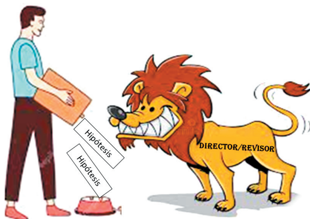
Figura 1. Ilustración metafórica de la exigencia, a veces injustificada, de incluir hipótesis en los proyectos de investigación en ecología. Este accionar muchas veces genera la inclusión de hipótesis inadecuadas que oscurecen el objetivo del trabajo, son lógicamente inviables de poner a prueba, determinan un diseño incorrecto, dificultan el desarrollo y la escritura del trabajo y generan un síndrome auto-inmune de rechazo al proyecto por parte del autor.

Incluir hipótesis cuando el estudio no lo requiere es una práctica tan nociva como no hacerlo cuando el estudio lo requiere. Como se discutió anteriormente, ciertos tipos de investigación no necesitan la formulación de hipótesis porque no ponen a prueba ideas ni intentan explicar la causa de un patrón. En