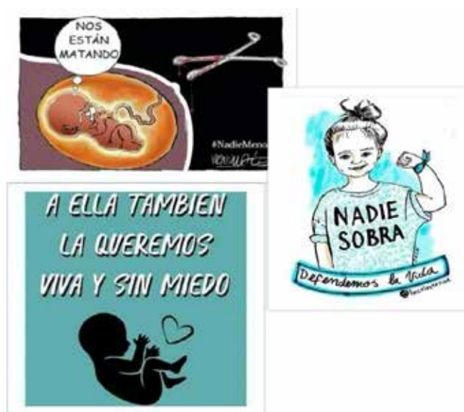
Figura 8. Apropiación del Repertorio Proelección

Nota: Collage de imágenes, adaptado de la cuenta de Instagram de Unidos por las dos vidas [@unidos_por_las_dos_vidas] De arriba abajo, de izquierda a derecha, los posts fueron publicados el 5 de noviembre, el 24 de junio y el 20 de octubre de 2018.