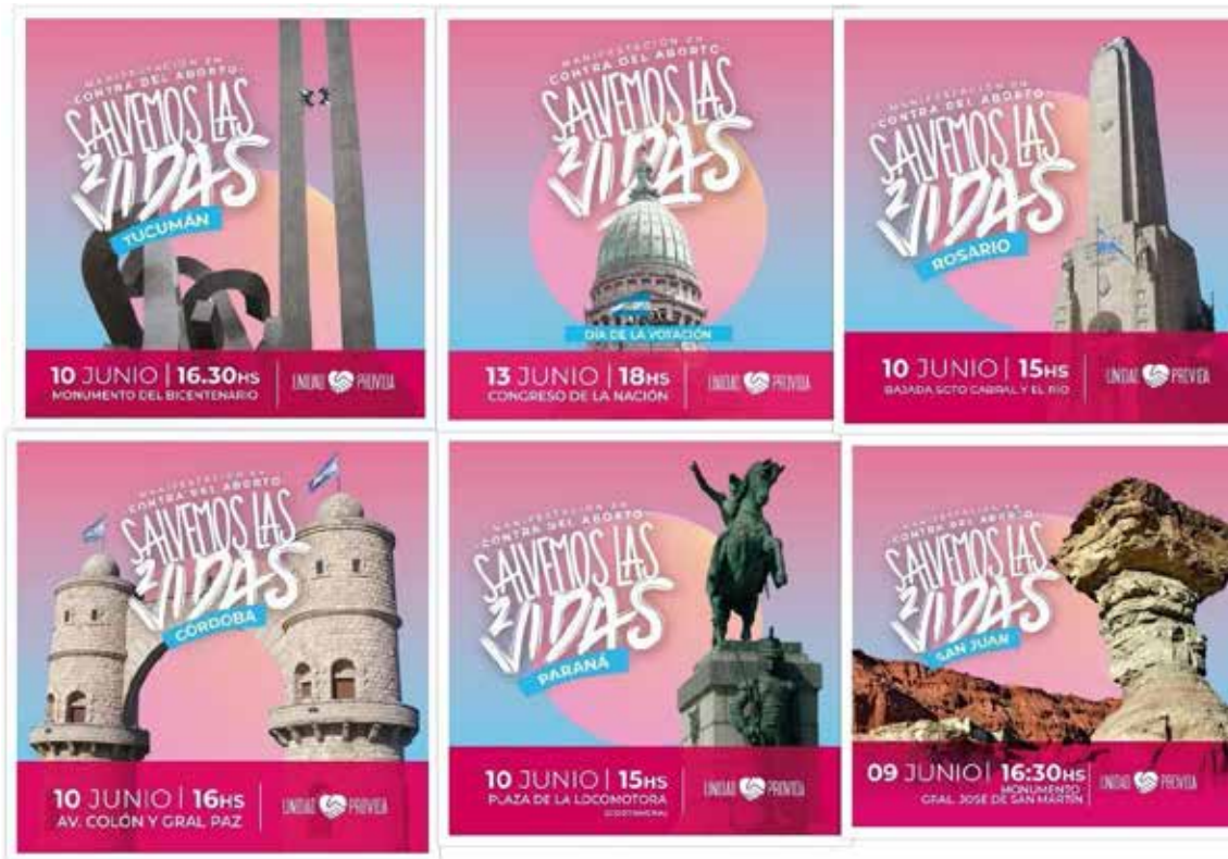
Figura 3. Carteles Informativos Sobre Movilizaciones

Nota: Collage de imágenes de la cuenta de Instagram de Unidad Provida [@unidadprovida]. Con la excepción de la segunda imagen de la fila de arriba, posteadas el 30 de mayo, todas las demás fueron publicadas el 6 de junio de 2018.