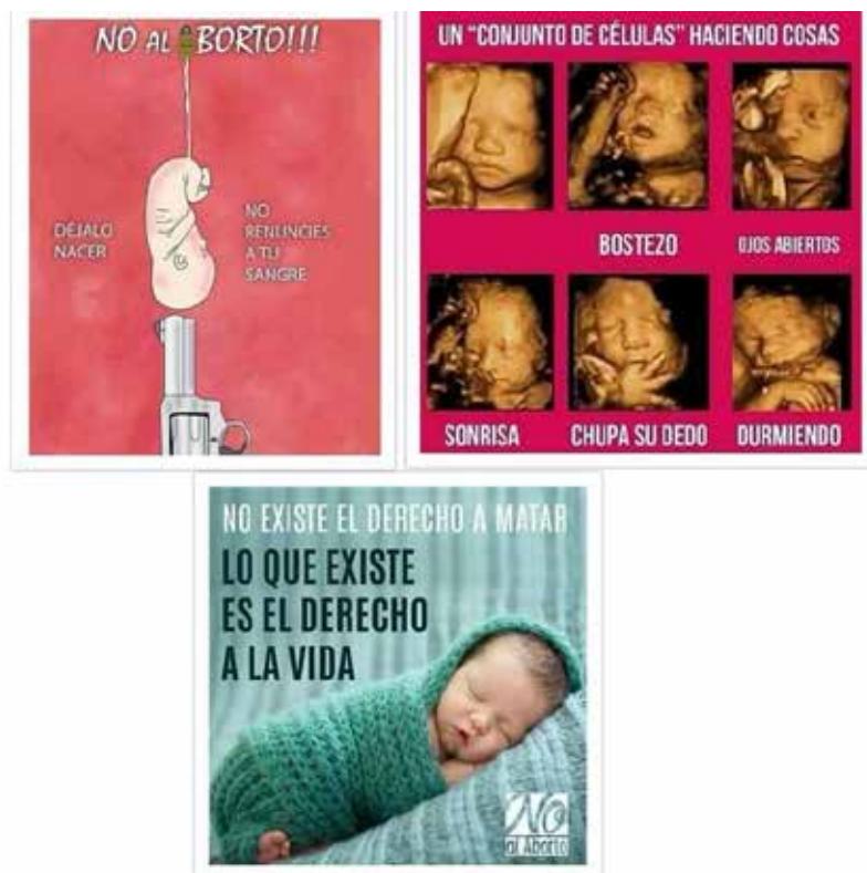
Figura 5. Imágenes de Fetos y Bebés

Nota: Collage de imágenes adaptado de la cuenta de Instagram de Unidos por las dos vidas [@unidos_por_las_dos_vidas]. De arriba abajo, de izquierda a derecha los posts fueron publicados el 30 de junio, el 12 de diciembre y el 5 de julio de 2018.