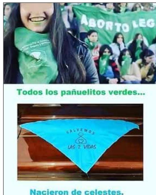
Figura 7. Contraposición Visual (Eje Arriba/Abajo)

Nota: De Salvemos las 2 vidas. [@unidos_por_las_dos_vidas]. (26 de septiembre de 2018). Muy cierto!! Muchas de las que están a favor del aborto NO se dan cuenta que nacieron de los celestes [Foto]. Instagram.