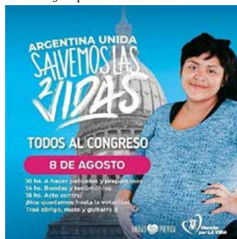
Figura 1. Ejemplo de temas visuales detectados

Nota. De Unidad Provida [@unidadprovida]. (6 de agosto de 2018). Un día vas a contar esta historia con orgullo, porque pase lo que pase el 8, estamos orgullosos de no [Foto]. Instagram.