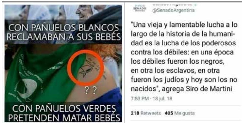
Figura 6. Aborto y Derechos Humanos

Nota: Collage de imágenes adaptado de la cuenta de Instagram de Unidos por las dos vidas