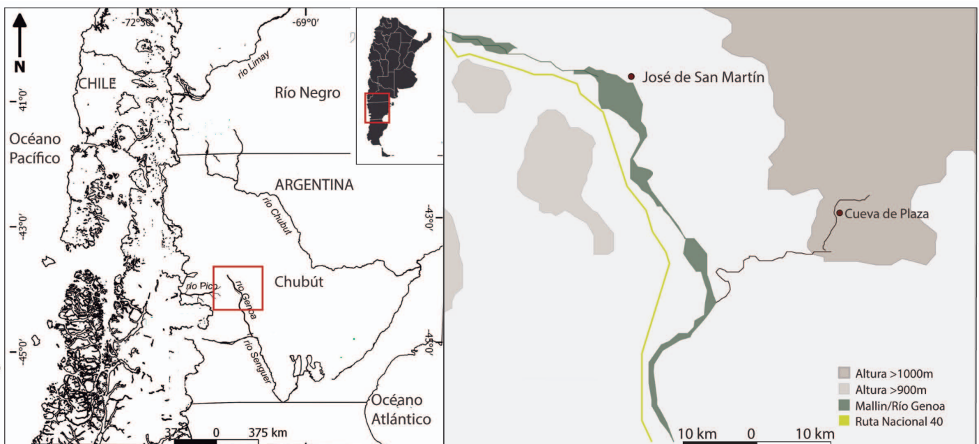
FIGURA 1. Izquierda: mapa de Patagonia Central y su ubicación en el territorio de Argentina. Derecha: Detalle de la ubicación de Cueva de Plaza, a 30km. lineales de la localidad más cercana, José de San Martín.

El sitio arqueológico Cueva de Plaza (CdP) está ubicado en el Valle del Genoa, en el oeste de la provincia del Chubut, Argentina (Fig. 1). Se trata de uno de los pocos sitios del área que presenta inhumaciones datadas en tiempos recientes (siglos XVIII y XIX). Dimos con este sitio a raíz de la denuncia de un vecino del área que descubrió la existencia de estos restos y nos manifestó su preocupación por su preservación. Por ello, realizamos un trabajo de rescate que comprendió la recolección de materiales superficiales y la excavación de ocho cuadrículas (4m2). Esta intervención se realizó en virtud del convenio establecido con la Secretaría de Cultura de la Provincia del Chubut por el cual se nos autorizó a desarrollar investigaciones arqueológicas en este sector. Se informó de esta acción y de los resultados a los integrantes de la comunidad