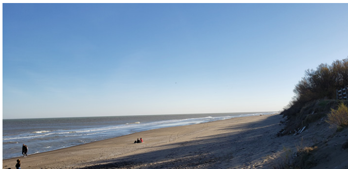
Figura 2: Playa de PehuenCó