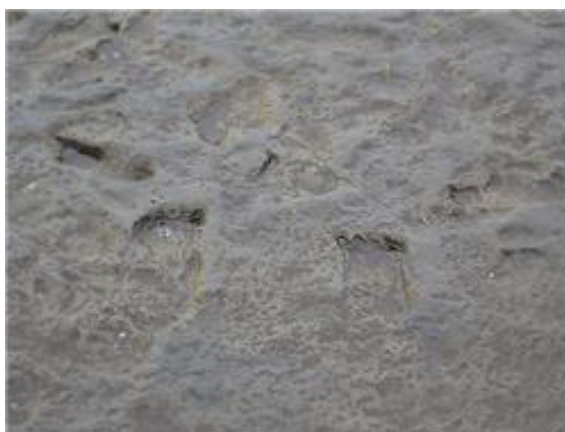
Figura 9: Fotografía de El pisadero

Área 3 (Partido de Monte Hermoso): ubicada en la ciudad de Monte Hermoso se encuentran los sitios La Olla 1 y La Olla 2 denominados también como el Pisadero (Figura 9), los cuales presentan pisadas de humanos y elementos con los que cazaban estos animales, tales como puntas de flecha, entre otras.