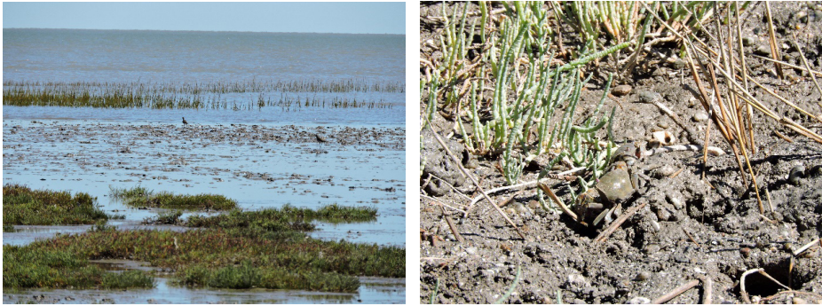
Figura 10: Paisaje del humedal de Villa del Mar