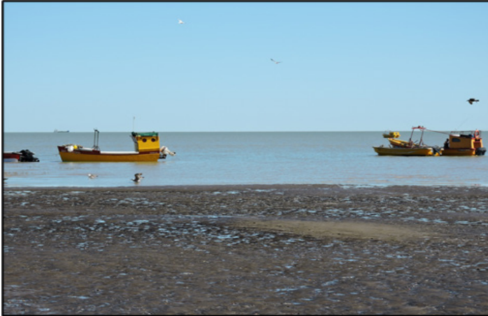
Figura 4: pescadores de Villa del Mar

Surge como una villa balnearia en la década del '30 para brindar un lugar alternativo de sol y playa para la región. Se caracteriza por ser una localidad de pescadores, con prácticas, saberes y festividades relacionadas a la pesca y el mar (Figura 4). Los pescadores asentados en la villa son descendientes de inmigrantes italianos, en su mayoría napolitanos, provenientes de familias de tradición pesquera (NOCETI, 2016).