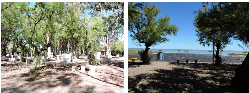
Figura 5: Balneario municipal y playa de Villa del Mar

Según datos del Censo Nacional 2010 (INDEC, 2010), Villa del Mar posee 327 habitantes. También un porcentaje menor que disfrutan el lugar en viviendas de fin de semana. A su vez, en época estival recibe visitantes al área de esparcimiento que posee la localidad (balneario municipal, playa, sendero interpretativo, Club náutico) (Figura 5).