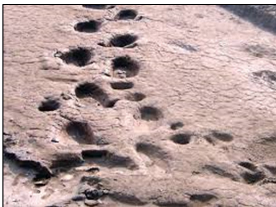
Figura 8: Fotografía de huellas de Megaterio

Área 2 (Partido de Coronel Rosales): ubicada a 2,5 km. al este de la localidad se encuentra el yacimiento de Paleoicnitas, aquí se pueden visitar las huellas con una antigüedad de 12.000 años de mega-mamíferos extintos como la macrauquénias, mastodontes, megaterios (figura 8) y gliptodontes. También se observan huellas de especies contemporáneas como teros, ñandúes, ciervos, pumas, guanacos, zorros, gatos monteses, entre otros.