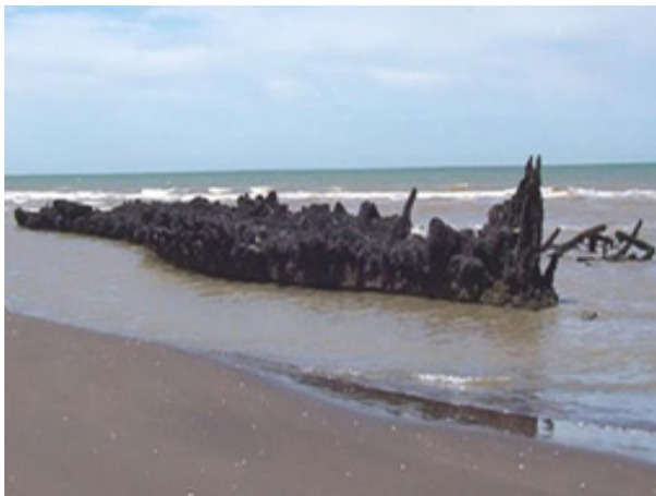
Figura 7: Fotografía de “Playa del Barco”