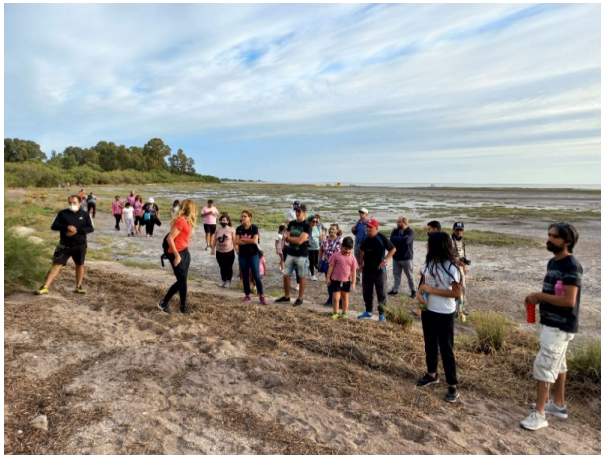
Figura 11: Sendero interpretativo de Villa del Mar

El humedal costero como recurso a valorar comenzó a ser aprovechado a través de visitas guiadas por un sendero interpretativo (Figura 11) que se delineó en el año 2000 sobre la costa de Villa del Mar. Esto se llevó a cabo a través de la Reserva Natural de Usos Múltiples Bahía Blanca, Bahía Falsa y Bahía Verde (RNUM) y fue en el 2009 que se inauguró oficialmente por el Organismo Provincial para el Desarrollo Sostenible (OPDS). Posterior a ello, por el 2012 la Fundación para la Recepción y Asistencia de Animales Marinos (FRAAM) instalada en Villa del Mar, comienza a ofrecer visitas guiadas a través de un programa de educación ambiental.