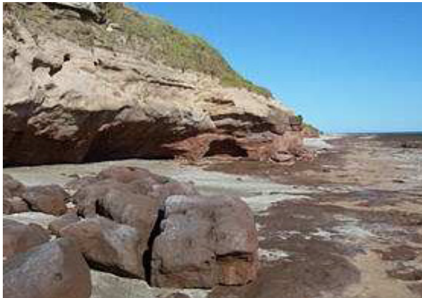
Figura 6: Fotografía de “Las Rocas”

Área 1 (Partido de Coronel Rosales): ubicada a 16 km. al oeste de la localidad, comprende la zona de acantilados, llamados Las Rocas o Barranca Monte Hermoso (Figura 6); son acantilados de 9 metros de altura con una antigüedad de 3 a 5 millones de años. A mil metros hacia el oeste, se encuentra la Playa del Barco (Figura 7) ubicada en terrenos pertenecientes al Ejército Argentino y solo se puede acceder con permisos de paso y durante marea baja, donde se pueden observar afloramientos de rocas sedimentarias con restos paleontológicos de 16.000 años de antigüedad.