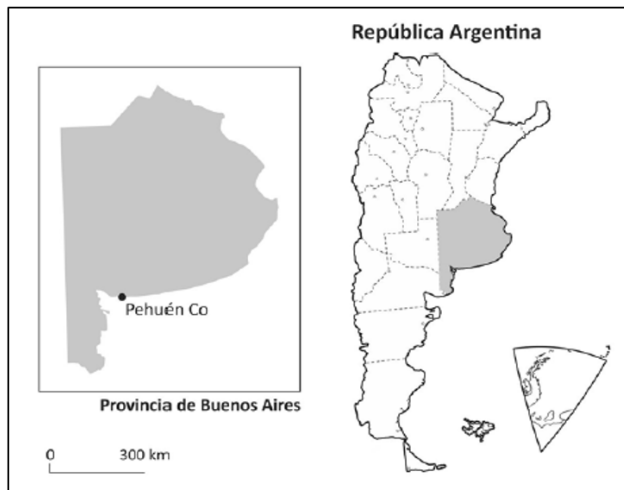
Figura 1: Localización de la localidad de PehuénCó