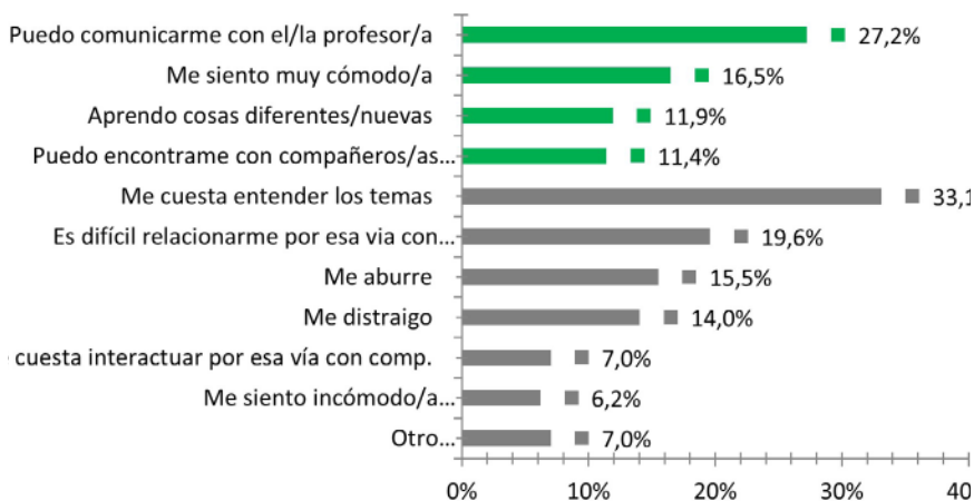
Figura 3.3. Percepción de lxs estudiantes del nivel secundario sobre las clases virtuales. Provincia de Neuquén. 2020

Fuente: elaboración propia en base a datos de la encuesta.