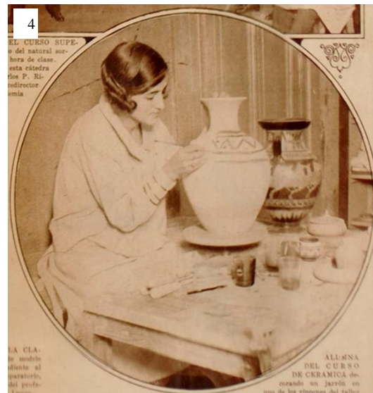
Sociedad de Educación Industrial. Biblioteca Escuela Técnica n°30, “Norberto Piñero”.